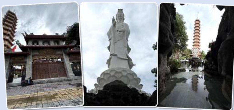
นางฟ้าพามู

จากนั้นนำท่านเดินทางสู่ หมู่บ้านกัมทาน สนุกสนานไปกับการเล่นกิจกรรม นั่งเรือกระดัง เป็นหมู่บ้านเล็กๆ ในเมืองฮอยอันตั้งอยู่ในสวนมะพร้าวริมแม่น้ำ ในอดีตช่วงสงครามที่นี่เป็นที่พักอาศัยของเหล่าทหาร อาชีพหลักของคนที่นี่คืออาชีพประมง ระหว่างการล่องเรือท่านจะได้ชมวัฒนธรรมอันสวยงาม ชาวบ้านจะขับร้องเพลงพื้นเมือง ผู้ชายกับผู้หญิงจะหยอกล้อกันไปมาน้ำที่พายเรือมาเคาะกันเป็นจังหวะดนตรี