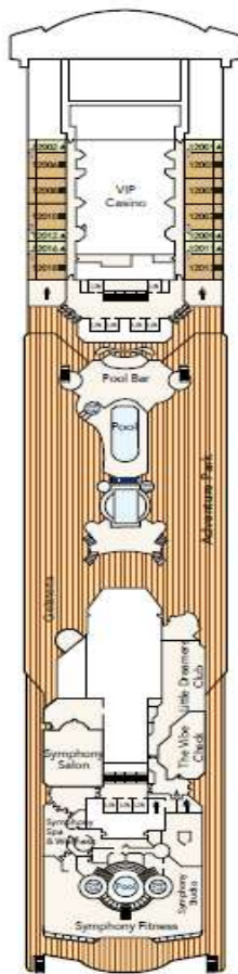
DECK 12 Water Activities, Adventure Park, Wellness & Fitness Centre, Little Dreamers Club, Bar & Suites