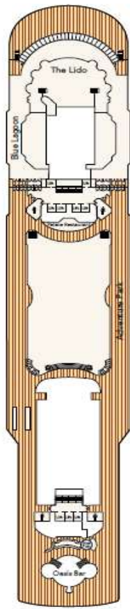
DECK 14 Hot tub, Adventure Park, Restaurants & Bar