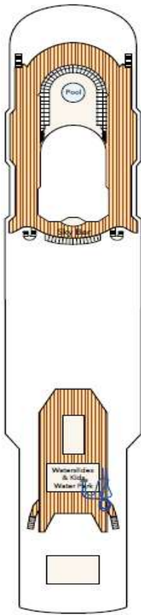
DECK 15 Water Activities & Bar