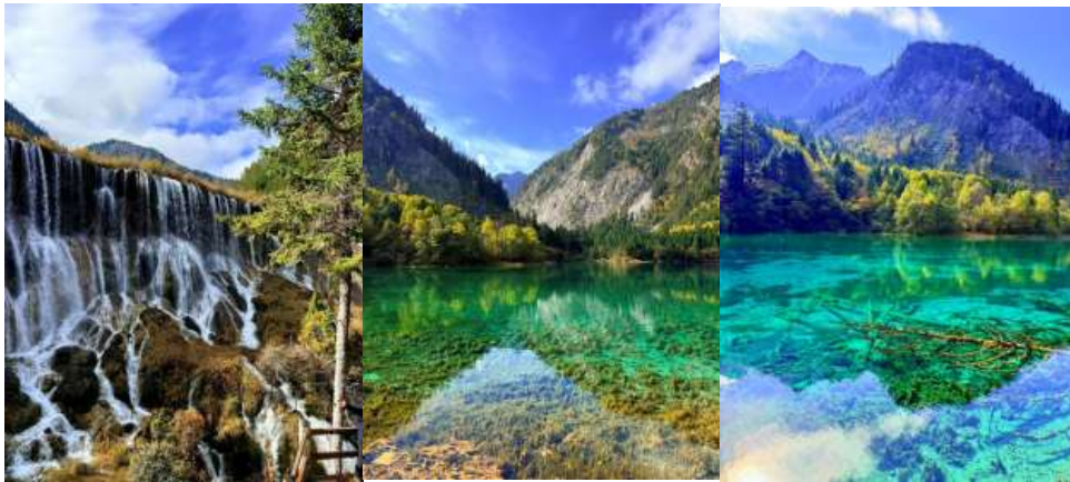
หรือเทียบเท่า