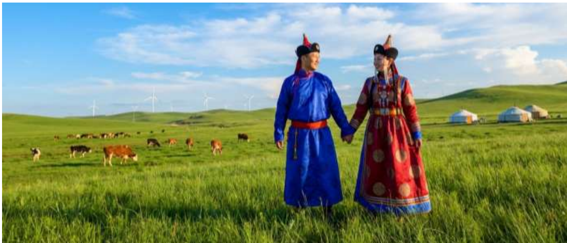
บ่าย นำท่านเข้าร่วมกิจกรรม สวมชุดแบบมองโกล สัมผัสพลังแห่งบรรพบุรุษ สวมเสื้อคลุมแบบดั้งเดิมที่มีสีสันสดใส ปักลวดลายอันประณีต คุณจะสัมผัสได้ถึงพลังแห่งบรรพบุรุษที่เคยปกครองดินแดนครึ่งโลก การสวม