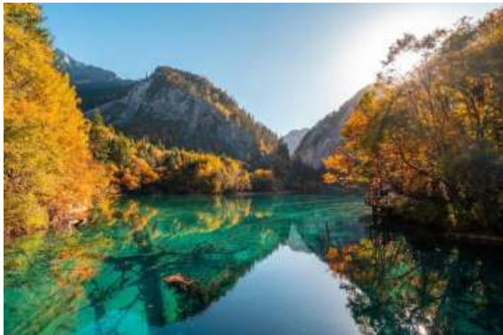
ทะเลสาบ5สี (Five Flower Lake)

หนึ่งในจุดที่สวยงามและนักท่องเที่ยวแวะมาเยี่ยมชมเยอะที่สุด ตั้งอยู่ที่ความสูงเหนือระดับน้ำทะเลประมาณ 2,472 เมตร น้ำลึกประมาณ 5 เมตร น้ำใสจนเห็นพื้นด้านล่างของทะเลสาบ สีของพื้นน้ำสวยงามแปลกตา โดยเฉพาะเมื่อยามแสงอาทิตย์สาดส่องกระทบผิวน้ำ สีของน้ำในทะเลสาบจะสะท้อนเป็นสีส้มถึง 5 เฉดสี สวยงามสะกดตา ซึ่งสาเหตุที่ทำให้เกิดสีส้มต่างๆ นี้มาจากการสะสมของแร่ธาตุ และพืชน้ำชนิดต่างๆ โดยจะมีสีส้มแตกต่างกันไปตามฤดูกาลและช่วงเวลา