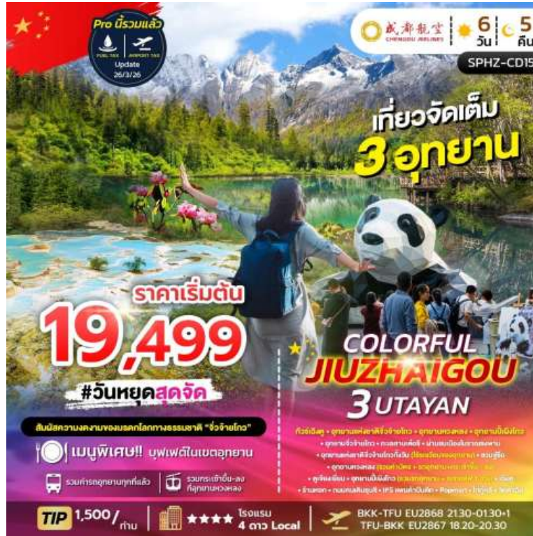
SPHZ-CD15 COLORFUL JIUZHAIGOU WITH 3 UTAYAN 6D5N