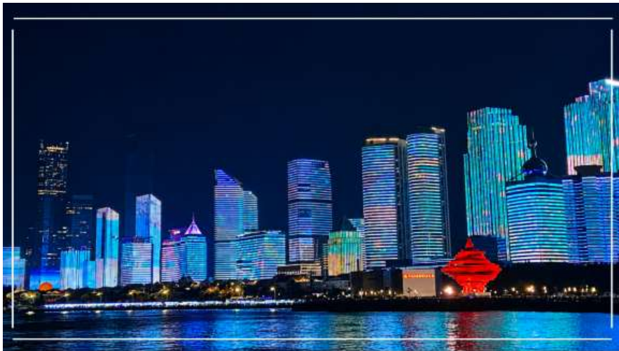
อิสระอาหารเย็นตามอัธยาศัย

คำคืนนี้ นำท่านสัมผัสความงดงามของ แสงสีอ่าวปูซาน การแสดงไฟสุดตระการตาที่ผสานเทคโนโลยีแสง สี และเสียงเข้าด้วยกันอย่างลงตัว อาคารสูงริมอ่าวจะถูกเนรมิตให้กลายเป็นจอแสดงภาพขนาดยักษ์ ถ่ายทอดเรื่องราว วัฒนธรรม และความทันสมัยของเมืองซิงเต่า ผ่านแสงไฟหลากสีที่เคลื่อนไหวอย่างมีจังหวะ สะท้อนผืนน้ำของอ่าวเกิดเป็นภาพงดงามเกินบรรยาย ท่ามกลางบรรยากาศลมทะเลเย็นสบาย เหมาะสำหรับการถ่ายภาพและเก็บความประทับใจยามค่ำคืน