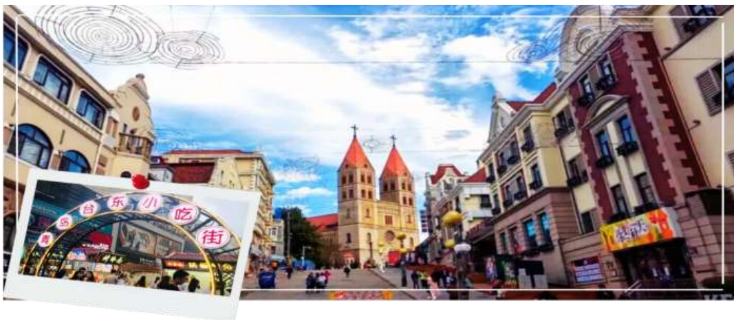
อิสระอาหารเย็นตามอัธยาศัย

นำท่านช้อปปิ้งที่ ถนนคนเดินไท่ตง สถานที่ยอดนิยมในชิงเต่าที่เต็มไปด้วยชีวิตชีวาทั้งกลางวันและกลางคืน เปรียบเสมือนถนนหนานจิงของเชียงใหม่ หรือถนนหวังฝูจิ่งของปักกิ่ง ตลอดทางจะมีห้างสรรพสินค้าและร้านค้ามากมายจำหน่ายสินค้าหลากหลาย ทั้งเสื้อผ้า รองเท้า อุปกรณ์กีฬา อิเล็กทรอนิกส์ และกีฬาฟุตบอล พร้อมทั้งอาหารอร่อยที่ต้องไม่พลาดชิม นอกจากนี้ยังมี Street Art สุดเก๋ให้ได้เดินชมและถ่ายรูปบริเวณกำแพงและตึกอพาร์ทเมนต์