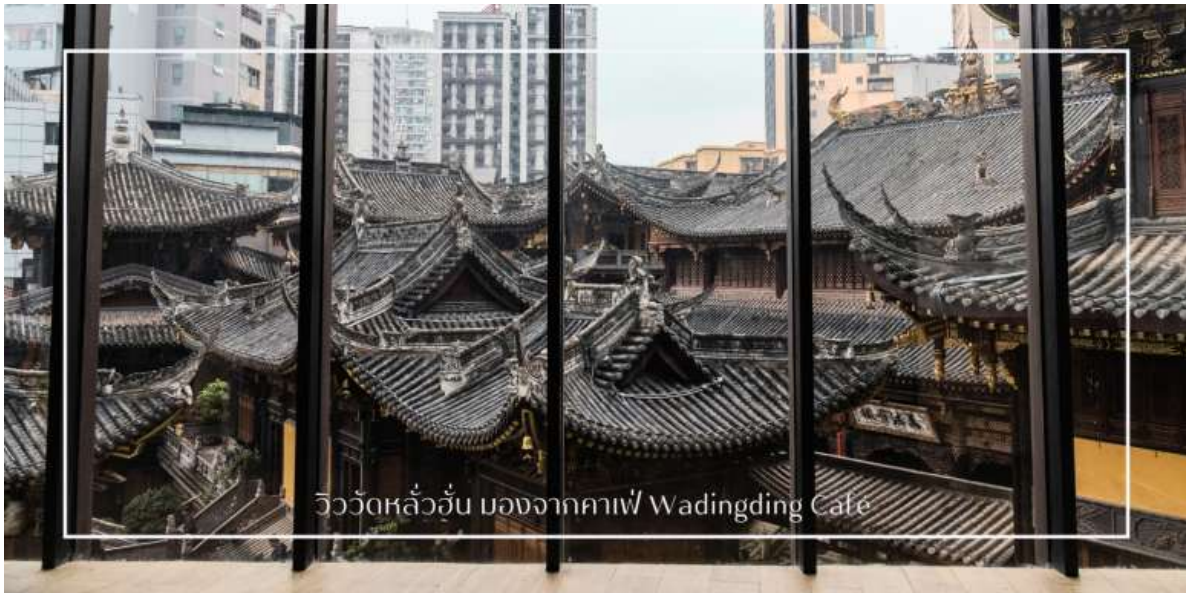
วิววัดหลั่วอัน มองจากคาเฟ่ Wadingding Cafe

นำท่านสู่น่าท่านเดินทางสู่ คาเฟ่ Wa Ding Ding Cafe สัมผัสประสบการณ์จับกาแฟในบรรยากาศที่ผสมผสานระหว่างโลกอนาคต และอดีต อย่างลงตัว บนชั้นดาดฟ้าตึก S95 ย่านเจียฟางเปย ไฮไลท์คือการชมวิว "วัดหลั่วอัน" วัดเก่าแก่พันปีผ่านกรอบกระจกบานใหญ่ ที่ได้รับการขนานนามว่าเป็นหนึ่งในจุดถ่ายรูปที่สวยงามที่สุดของมหานครฉงชิ่ง ให้ท่านได้เก็บภาพความประทับใจของหลังคาวัดสีทองอร่ามที่ตัดกับตึกสูงระฟ้าใจกลางเมือง พร้อมดื่มด่ำกับเครื่องดื่มที่รังสรรค์มาอย่างพิถีพิถัน