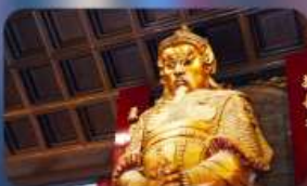
วัดแซกทมิว