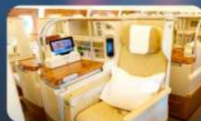
BUSINESS CLASS "บินกลับ"