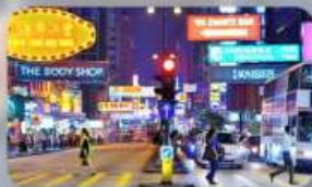
จิมซาจู้