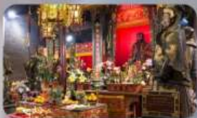
วัดปิกโก