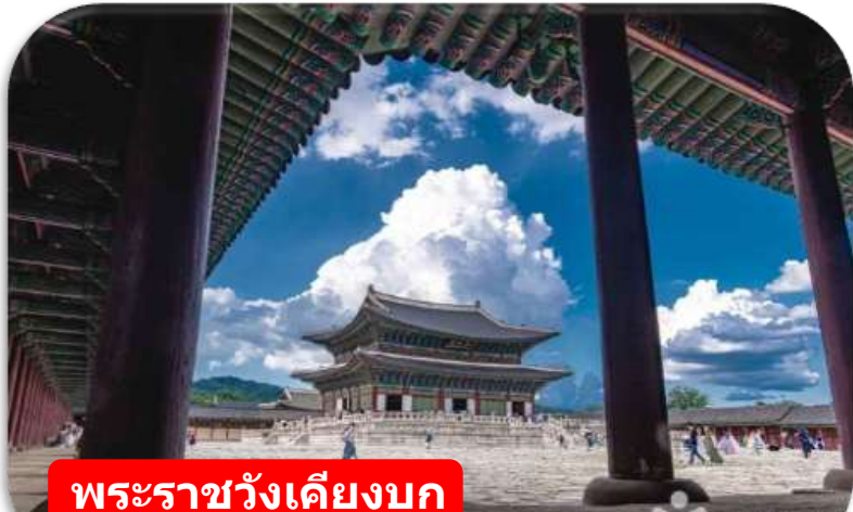
พระราชวังเคียงบก

พระราชวังเคียงบก (Gyeongbokgung) ไม่รวมค่าเช่าชุดฮันบก พระราชวังหลวงที่ยิ่งใหญ่ที่สุดของเกาหลี ท่านสามารถเดินถ่ายรูปภายในพระราชวัง ท่ามกลางสถาปัตยกรรมโบราณอันงดงาม ไม่ว่าจะเป็นห้องพระโรง ศาลาริมสระน้ำ และฉากภูเขาด้านหลังที่สวยงาม พร้อมทั้งเข้าชมพิพิธภัณฑ์พื้นบ้านเกาหลี