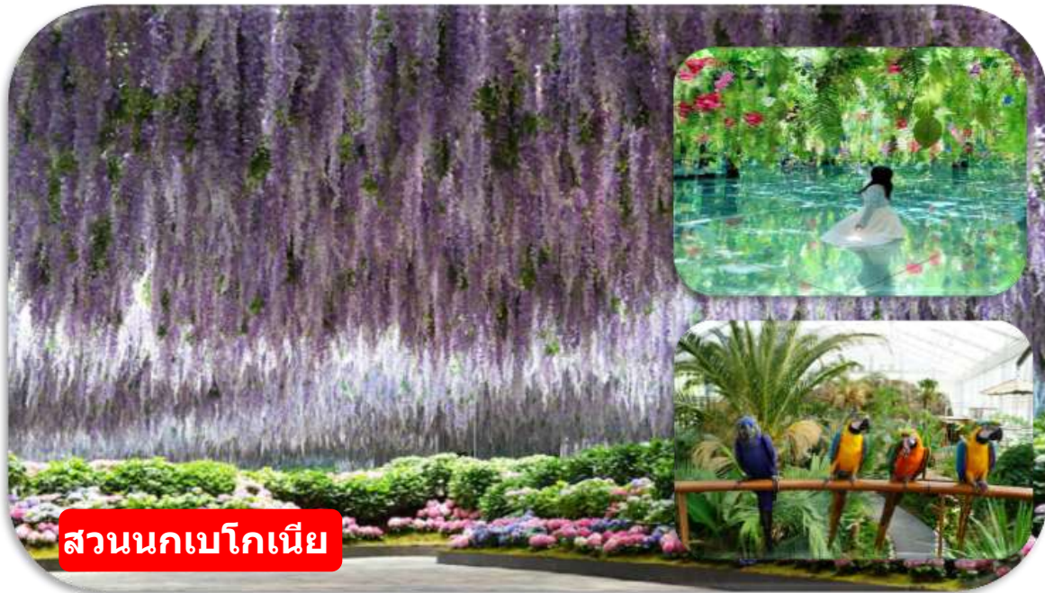
สวนนกเบโกเนีย

สวนนกเบโกเนีย เมืองคาพยอง (Begonia Bird Park) สวนธรรมชาติและเรือนกระจกขนาดใหญ่ที่ผสมผสานโลกของดอกไม้และสัตว์ปีกไว้อย่างลงตัว ภายในสวนจัดแสดง ดอกเบโกเนียหลากหลายสายพันธุ์สีสันสดใสตลอดทั้งปี ให้ท่านจะได้เพลิดเพลินกับการเดินชมสวนดอกไม้ พร้อมใกล้ชิดกับนกสายพันธุ์ต่าง ๆ