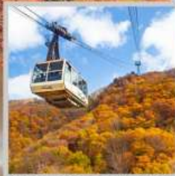
"ZAO CHUO ROPEWAY"