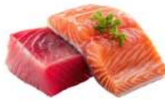
● ไส้ทานปลาดิบ