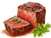
● ไส้ทานเนื้อวัว

ขอความกรุณาแจ้งวัตถุประสงค์ที่ท่าน แพ้หรือไม่สามารถรับประทานได้