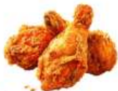
● ไส้ทานสัตว์ปีก (ไก่)