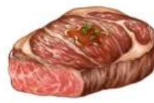
● ไส้ทานเนื้อหมู