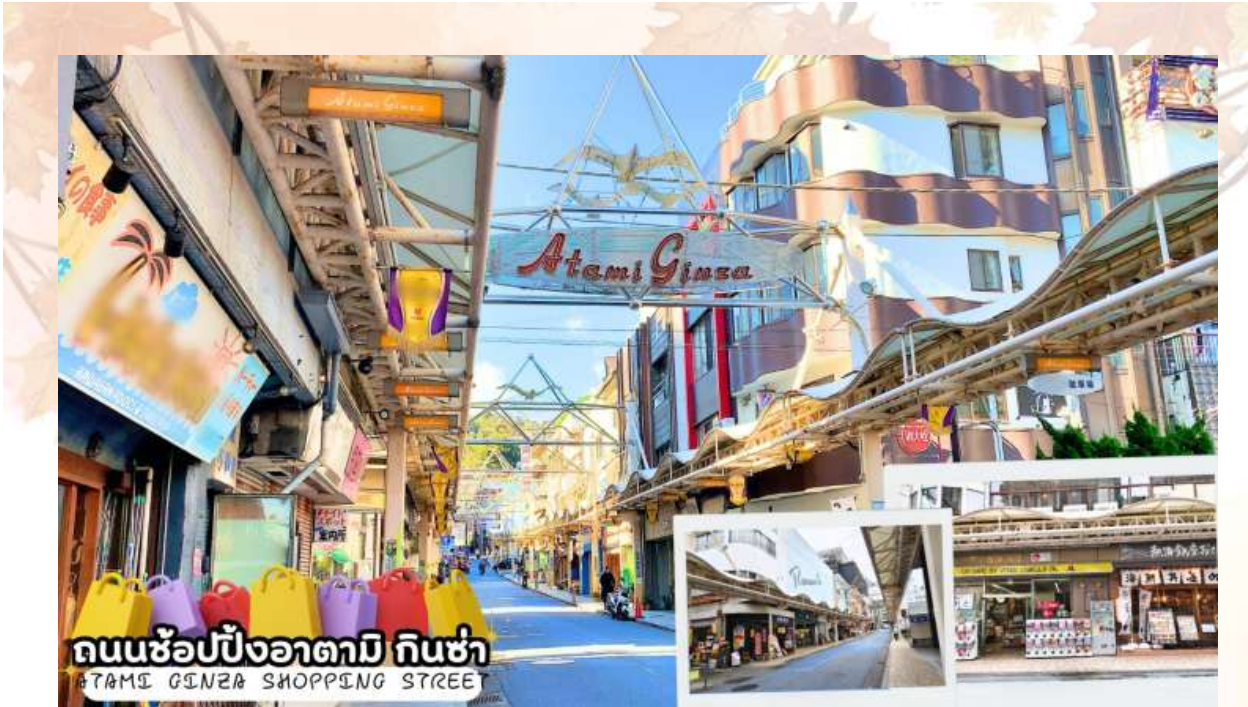
ถนนช้อปปิ้งอาตามิ กินซ่า ATAMI GINZA SHOPPING STREET

ถนนช้อปปิ้งอาตามิ กินซ่า (Atami Ginza Shopping Street) ตั้งอยู่บนถนนกินซ่า ศูนย์กลางของบ่อน้ำพุร้อนอาตามิในสมัยเอโดะ และชายฝั่งทะเล แหล่งช้อปปิ้งหลักสำหรับนักท่องเที่ยวและคนท้องถิ่น อาคารสไตล์ย้อนยุคหลายแห่งยังคงหลงเหลืออยู่ให้ความรู้สึกคิดถึงวันวาน ที่โดดเด่นด้วยบรรยากาศย้อนยุคสมัยโชวะ ผสมผสานกับร้านค้าสมัยใหม่ มีค่าเฟ่ที่น่ารักๆ ภายในร้านจะตกแต่งที่นั่งเป็นแบบห้องออนเซ็น และยังจะมีพุดding ซอฟครีมรวมไปถึงกาแฟ ให้ท่านได้ลิ้มลอง และยังมีร้านเครฟชาเขียวที่ขึ้นชื่ออีกด้วย รวมไปถึงร้านอาหารทะเลราคาย่อมเยาว์