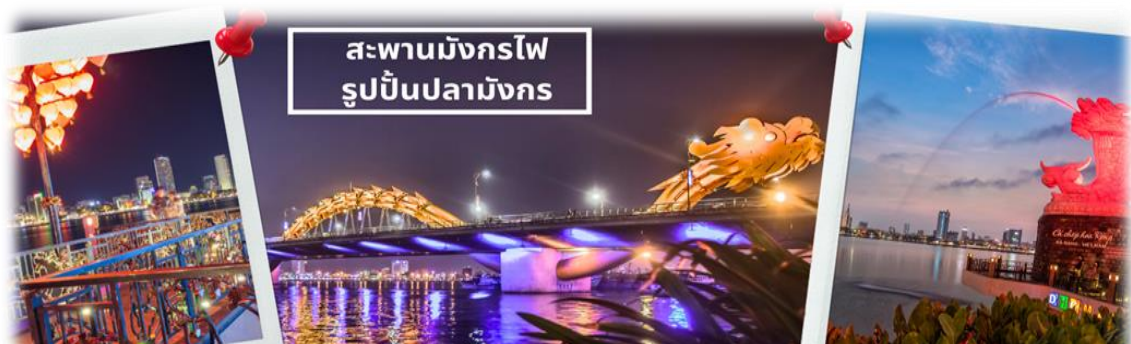
สะพานมังกรไฟ รูปปั้นปลามังกร

จากนั้นนำท่านชม สะพานแห่งความรัก ที่นิยมของหนุ่มสาวคู่รักกันมาซื้อกุญแจใส่คล้องใส่สะพาน จากนั้นนำท่านชม รูปปั้นปลามังกร ที่เป็นสัญลักษณ์ของเมืองดานัง เมืองที่กำลังจะกลายเป็นมังกรในระยะใกล้แห่งเอเชียตะวันออกเฉียงใต้ เชิญท่านเพลิดเพลินกับความอลังการของ สะพานมังกรไฟ ที่มีความยาวถึง 666 เมตร เป็นสะพาน 6 เลนส์