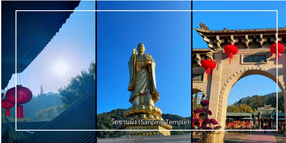
วัดซานผิง (Sanping Temple)

นำท่านสู่ วัดซานผิง (Sanping Temple) เมืองจิงโจว วัดพุทธที่มีความสำคัญทางประวัติศาสตร์และเป็นที่เคารพนับถืออย่างสูงของพุทธศาสนิกชน วัดแห่งนี้มีชื่อเสียงในฐานะศูนย์รวมแห่งศรัทธาและเป็นสถานที่ปฏิบัติธรรมที่สืบทอดมาอย่างยาวนาน วัดซานผิงโดดเด่นด้วยบรรยากาศอันสงบ ร่มรื่น รายล้อมด้วยธรรมชาติและสถาปัตยกรรมจีนดั้งเดิมอันงดงามผู้มาเยือนสามารถสักการะสิ่งศักดิ์สิทธิ์ เรียนรู้ประวัติความเป็นมาของวัด และสัมผัสถึงความสงบทางจิตใจ