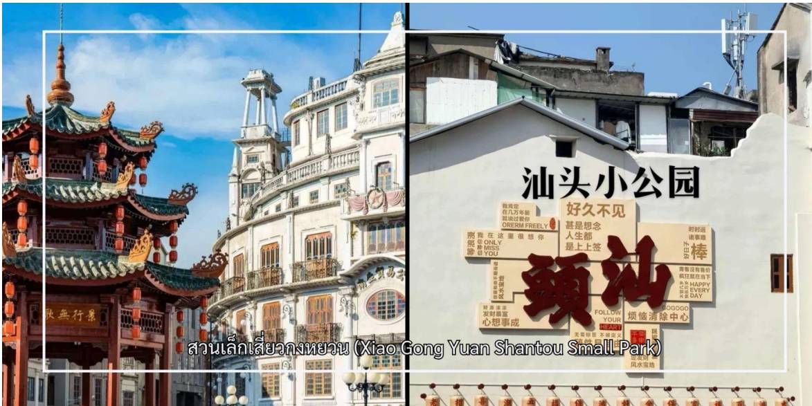
สวนเล็กเสี่ยวกงหยวน (Xiao Gong Yuan Shantou Small Park)

แวะชม สวนเล็กซีวเถา หรือที่รู้จักกันในชื่อ เสี่ยวกงหยวน (Xiao Gong Yuan Shantou Small Park) สถานที่สำคัญทางประวัติศาสตร์และวัฒนธรรมใจกลางเมืองซีวเถา ที่สะท้อนถึงพัฒนาการของเมืองในช่วงการเปิดท่าเรือการค้าในอดีต พื้นที่แห่งนี้เคยเป็นศูนย์กลางความเจริญและกิจกรรมทางสังคมของชุมชนมาอย่างยาวนาน บริเวณโดยรอบสวนรายล้อมด้วยอาคารสไตล์จีนผสมตะวันตกอันเป็นเอกลักษณ์ แสดงถึงอิทธิพลทางสถาปัตยกรรมจากยุคการค้าระหว่างประเทศ