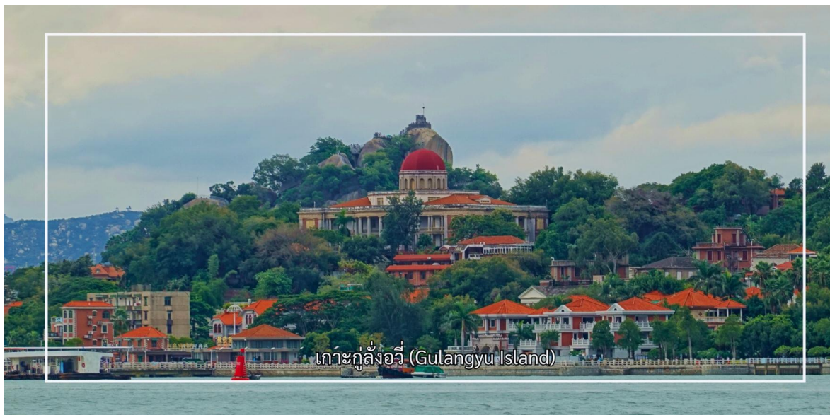
เกาะกู่ลิ่งอวี่ (Gulangyu Island)

สมควรแก่เวลานำท่านเดินทางกลับเซี่ยเหมิน นำท่านสู่ เกาะกู่ลิ่งอวี่ (Gulangyu Island) เกาะเล็กอันมีเสน่ห์ที่มีชื่อเสียงด้านสถาปัตยกรรมอันงดงามที่ผสมผสานระหว่างสไตล์ตะวันตกและจีน สะท้อนถึงประวัติศาสตร์การติดต่อค้าขายกับชาติ