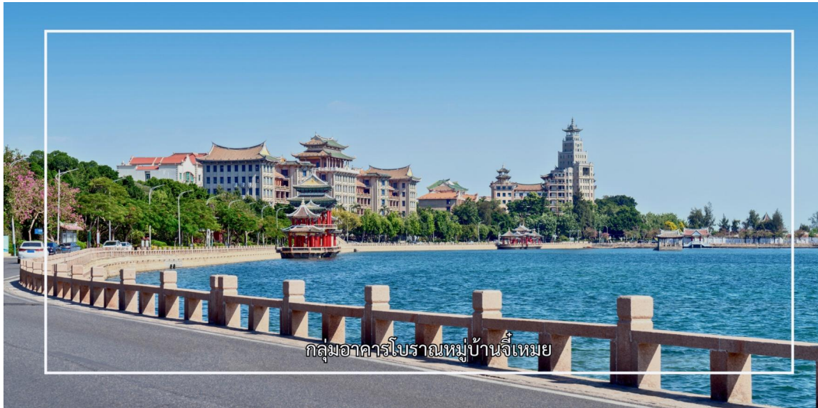
กลุ่มอาคารโบราณหมู่บ้านจีเหมย

นักธุรกิจและนักการศึกษาผู้มีชื่อเสียง ซึ่งมีบทบาทสำคัญในการพัฒนาพื้นที่ที่จัดเตรียมให้เป็นศูนย์กลางด้านการศึกษา และวัฒนธรรม สถาปัตยกรรมของหมู่บ้านจีเหมยมีลักษณะเฉพาะ เรียกว่า “สไตล์จีเหมย” ซึ่งเป็นการผสมผสานระหว่างศิลปะจีนดั้งเดิมกับอิทธิพลตะวันตก หลังคาทรงจีน ผนังอิฐสีอ่อน คุ้มประตู และรายละเอียดการตกแต่งที่ประณีต สะท้อนถึงความงดงามและคุณค่าทางประวัติศาสตร์อย่างชัดเจน พื้นที่ภายในประกอบด้วยอาคารเรียน วัด ศาลา และบ้านพักที่จัดวางอย่างเป็นระเบียบ สอดคล้องกับภูมิทัศน์โดยรอบ