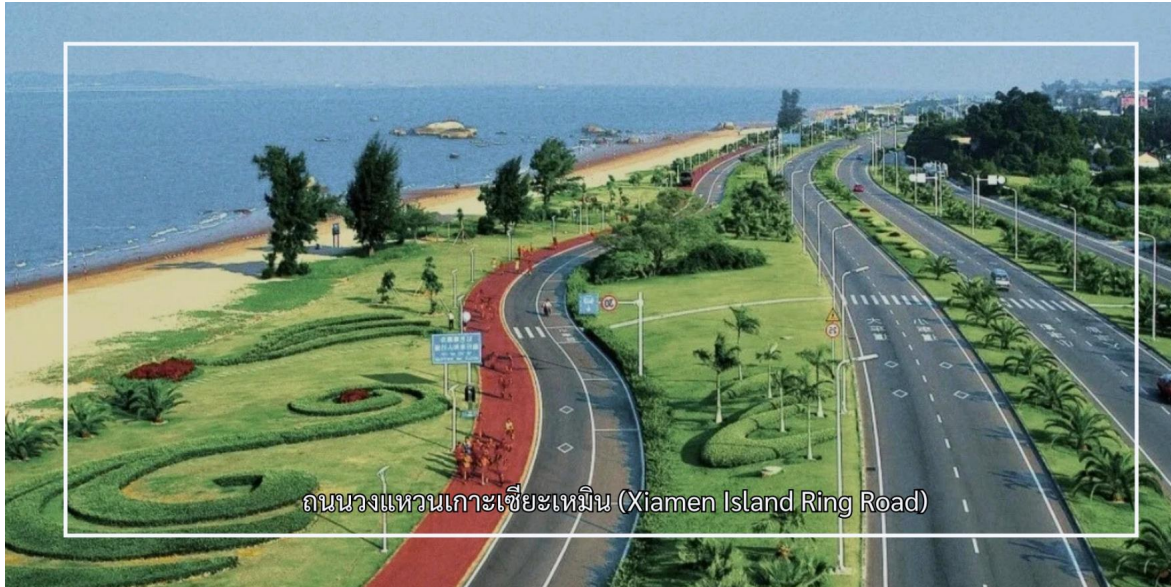
ถนนวงแหวนเกาะเซี่ยเหมิน (Xiamen Island Ring Road)

จากนั้นนำท่านอิสระช้อปปิ้ง ถนนคนเดินจงซาน (Zhongshan Road Walking Street) เป็นถนนสายการค้าที่มีชื่อเสียงและคึกคักที่สุดแห่งหนึ่งของเมืองเซี่ยเหมิน ถนนสายนี้เต็มไปด้วยร้านค้า ร้านอาหาร คาเฟ่ และแหล่งช้อปปิ้งหลากหลายรูปแบบ พร้อมสถาปัตยกรรมสไตล์จีนผสมตะวันตกที่เป็นเอกลักษณ์ สะท้อนถึงประวัติศาสตร์และความเจริญของเมืองในอดีต ท่านสามารถ เพลิดเพลินกับการเลือกซื้อสินค้า ลิ้มลองอาหารท้องถิ่นขึ้นชื่อ และเดินชมบรรยากาศย่านการค้าเก่าแก่ที่มีชีวิตชีวา ถนนคนเดินจงซานจึงเป็นจุดหมายสำคัญที่ผสานทั้งการช้อปปิ้ง วัฒนธรรม และวิถีชีวิตของชาวเซี่ยเหมินไว้ได้อย่างลงตัว