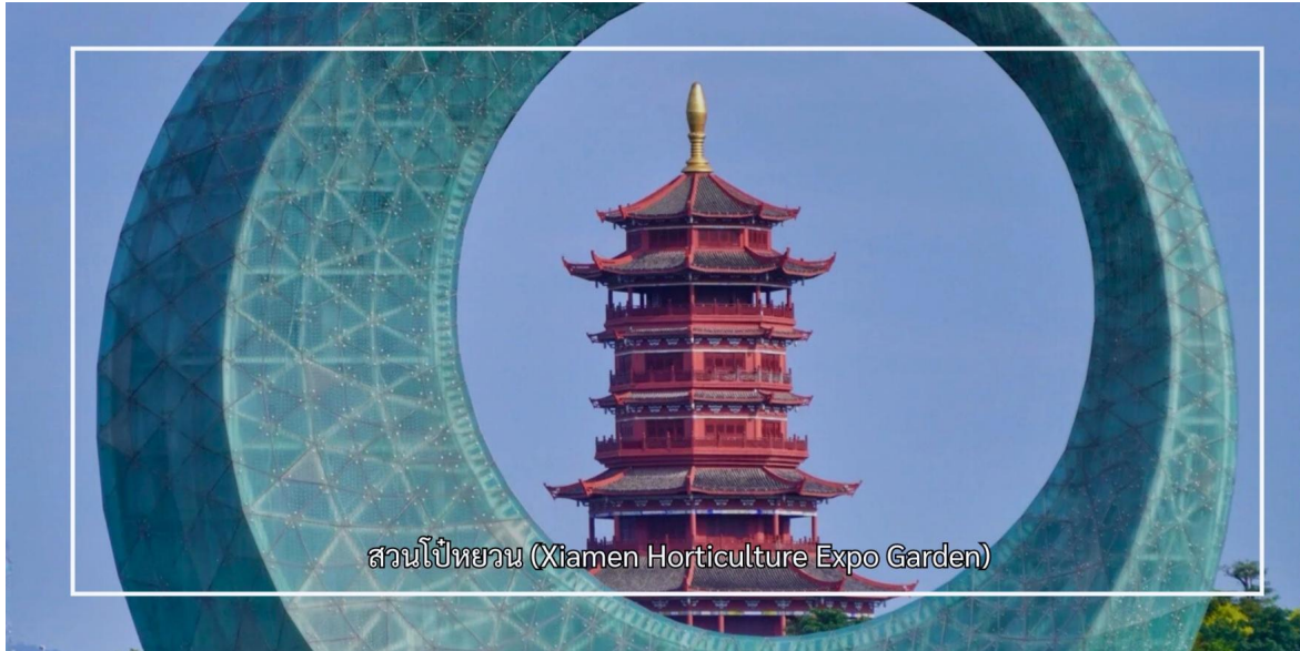
สวนไป๋หยวน (Xiamen Horticulture Expo Garden)

จากนั้นชม หอชมวิวไข่มุกทะเล (Sea Pearl Observation Tower) เป็นจุดชมวิวที่โดดเด่นและเป็นสัญลักษณ์สำคัญของเมือง ด้วยความสูงประมาณ 195 เมตร หอชมวิวแห่งนี้เปิดมุมมองทัศนียภาพแบบ 360 องศา ให้ผู้มาเยือนได้ชมความงดงามของเมืองเซี่ยเหมิน ชายฝั่งทะเล และภูมิทัศน์โดยรอบอย่างเต็มตา และเก็บภาพความประทับใจของเมืองท่าที่มีเสน่ห์แห่งนี้ จากนั้นเพลิดเพลินกับประสบการณ์ความบันเทิงที่ โรงภาพยนตร์โกลบอล ซึ่งนำเสนอภาพยนตร์และสื่อมัลติมีเดียทันสมัย ถ่ายทอดเรื่องราวและวัฒนธรรมของเมืองในรูปแบบที่น่าสนใจ ช่วยเติมเต็มการท่องเที่ยวให้ทั้งได้ชมวิวก่อน และเรียนรู้ไปพร้อมกัน