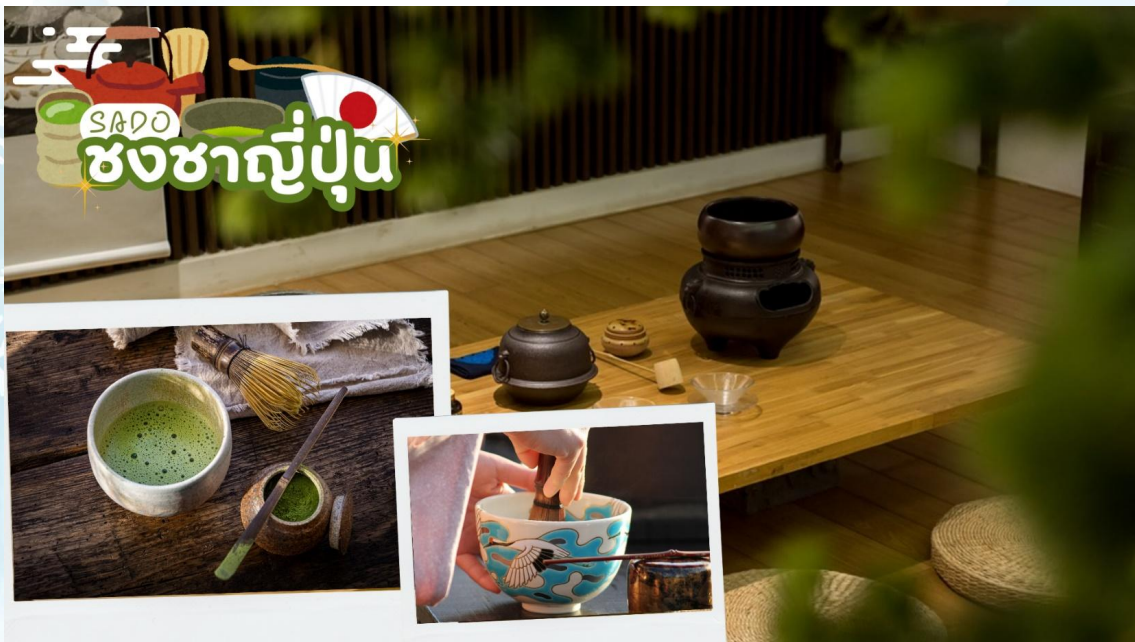
SADO ชงชาญี่ปุ่น

ศาลเจ้าเฮอัน (Heian Shrine) สร้างขึ้นเพื่อเป็นอนุสรณ์ฉลองอำนาจปกครองของเมืองเกียวโตที่ครบรอบ 1,100 ปีในฐานะเมืองหลวงของประเทศญี่ปุ่น โดยมีประตูโทริอิสีแดงตระหง่านเป็นองค์ประกอบที่สะดุดตาที่สุด ศาลเจ้าแห่งนี้เป็นสัญลักษณ์อันโดดเด่นและสถานที่ท่องเที่ยวสำคัญของเกียวโต บริเวณด้านหลังของศาลเจ้านี้ มีสวนเฮอัน ครอบคลุมพื้นที่ประมาณ 33,000 ตารางเมตร สามารถเดินเล่นสัมผัสความร่มรื่นได้อย่างสงบผ่อนคลาย บรรยากาศธรรมชาติของที่นี่เรียกว่าสวยงามทุกฤดูกาล