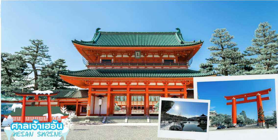
ศาลเจ้าเฮอัน HEIAN SHRINE

ศาลเจ้าเฮอัน (Heian Shrine) สร้างขึ้นเพื่อเป็นอนุสรณ์ฉลองอำนาจปกครองของเมืองเกียวโตที่ครบรอบ 1,100 ปีในฐานะเมืองหลวงของประเทศญี่ปุ่น โดยมีประตูโทริอิสีแดงตระหง่านเป็นองค์ประกอบที่สะดุดตาที่สุด ศาลเจ้าแห่งนี้เป็นสัญลักษณ์อันโดดเด่นและสถานที่ท่องเที่ยวสำคัญของเกียวโต บริเวณด้านหลังของศาลเจ้านี้ มีสวนเฮอัน ครอบคลุมพื้นที่ประมาณ 33,000 ตารางเมตร สามารถเดินเล่นสัมผัสความร่มรื่นได้อย่างสงบผ่อนคลาย บรรยากาศธรรมชาติของที่นี่เรียกว่าสวยงามทุกฤดูกาล