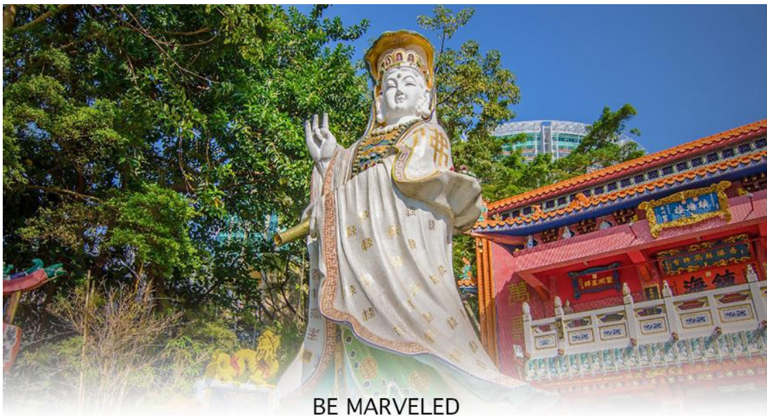
BE MARVELED วัดเจ้าแม่กวนอิมริพัลส์เบย์

เรื่องการเงิน และขอพรขอโชคลาภเพื่อเป็นสิริมงคลและขอพร เจ้าแม่ทับทิม หรือ เทพธิดาแห่งท้องทะเล ซึ่งทำหน้าที่ปกป้องคุ้มครองชาวประมง ตั้งโดดเด่นอยู่ท่ามกลางสวนสวยที่ทอดยาวลงสู่ชายหาดให้ท่านนมัสการขอ และนำท่านเดินข้าม สะพานต่ออายุ ซึ่งเชื่อกันว่าข้ามหนึ่งครั้งจะมีอายุเพิ่มขึ้น 3 ถ้าข้ามแล้วห้ามเดินย้อนกลับไปเด็ดขาด เพราะคนฮ่องกงเชื่อว่าชีวิตจะสั้นลงไป 3 ปี สำหรับคนโสดจะนิยมขอพรกับ เทพเจ้าแห่งความรัก ให้เอามือลูบที่บริเวณหินสีดำ พร้อมกับอธิษฐานให้สมหวังกับความรัก ปิดท้ายด้วยการรับพลังฮวงจุ้ยจาก ศาลา แผลทิต ซึ่งถือเป็นจุดรวมรับพลัง ถือเป็นจุดที่มีฮวงจุ้ยดีที่สุดของเกาะฮ่องกง และยังมีรูปปั้นองค์เทพอีกมากมายภายในวัดแห่งนี้ให้กราบไหว้ขอพร