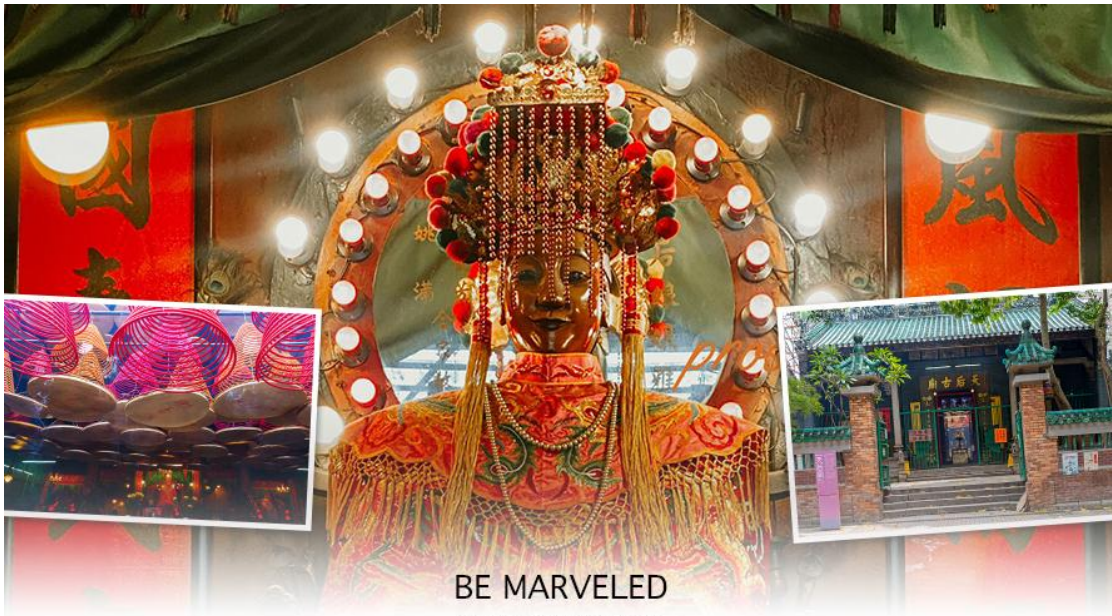
BE MARVELED วัดเจ้าแม่ทับทิมทินหัว

ทองเหลืองอยู่ด้านล่าง นอกจากการมาสักการะบูชาเจ้าแม่ทับทิมในเรื่องของการเดินทางให้ปลอดภัยแล้ว ไฮไลท์สำคัญอีกอย่างหนึ่งของวัดเจ้าแม่ทับทิม ทินหัว (Tin Hau Temple) จะเป็นขลุ่ยสีแดงขนาดใหญ่ ที่แขวนอยู่ตามเพดานด้านในวิหารของวัดเต็มไปหมด จะยิ่งสวยงามในยามที่มีแสงแดงส่องลงมาเหมือนเป็นลำแสงส่องทะลุควันธูปแปลกตาอย่างยิ่งนัก ส่วนอาคารของวัดก็จะเป็นสถาปัตยกรรมแบบวัดจีน สร้างขึ้นตั้งแต่ปีค.ศ. 1876 โดยทางเข้าของวัดจะอยู่ติดกับสวนสาธารณะเล็กๆ ที่มีต้นไม้ใหญ่หลายต้น ให้บรรยากาศร่มรื่น