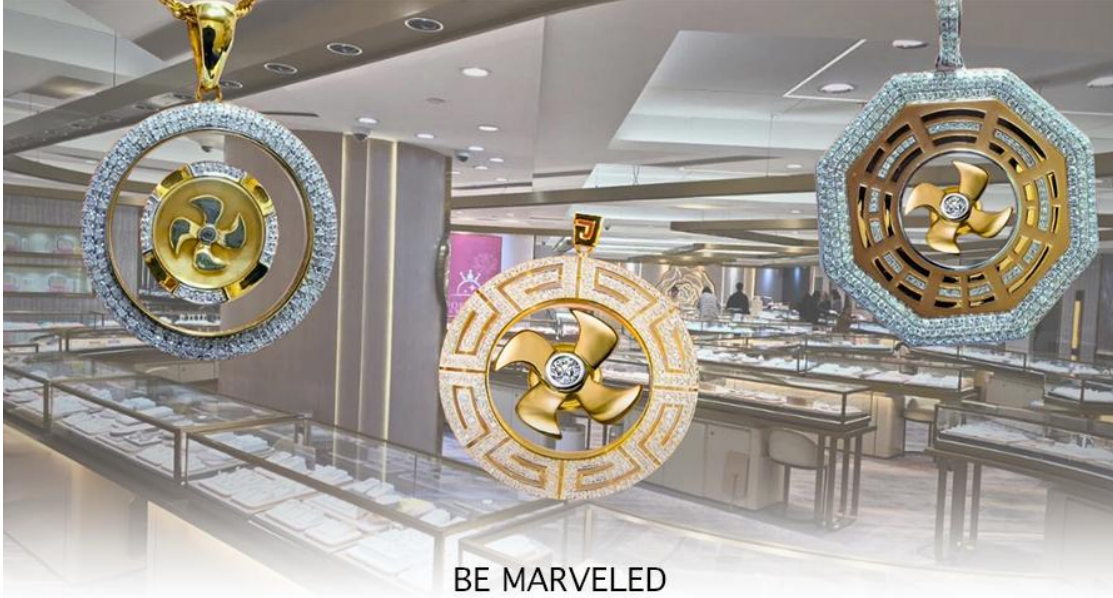
BE MARVELED ศูนย์ฮวงจุ้ย กว๊านนครศรี

และนำท่าน ชม ศูนย์ปี่เซียะ ซึ่งคนจีนนั้น ถือว่าหยกเป็นหิน ที่เป็นตัวแทนของความสวยงามและความบริสุทธิ์มีความเชื่อว่าหยก มงคล ถ้าพกติดตัวไว้จะอายุยืนและสุขภาพดีมีสินค้ำมากมายเกี่ยวกับหยก อาทิ กำไลหยก หรือสัตว์นำโชคอย่างปี่เซียะ ให้ท่าน ได้เลือกซื้อเป็นของฝาก, ของที่ระลึก หรือของนำโชคแต่ตัวท่านเอง