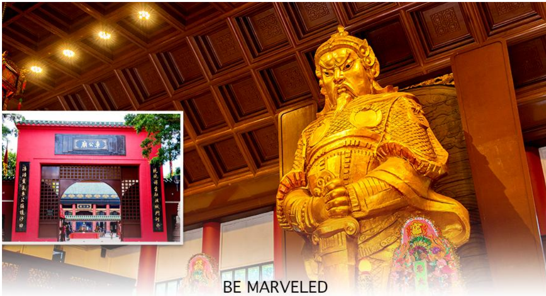
BE MARVELED วัดแขก

นำท่านเดินทางสู่ วัดแขกหมิว หรืออีกชื่อหนึ่งว่า “วัดกังหันลม” หนึ่งในวัดดังของฮ่องกง ที่ประชาชนให้ความเลื่อมใสศรัทธามานาน ด้านในศาลจะมีรูปปั้นสูงใหญ่ของท่านแชกง ซึ่งเป็นเทพประจำวัดแห่งนี้ เชื่อว่าองค์ท่านศักดิ์สิทธิ์ในการขอพรด้านโชคลาภ เสริมความเป็นสิริมงคล บัดเป่าเรื่องราวๆออกไป และวัดแห่งนี้ยังเป็นสถานที่ที่นิยมสำหรับท่านที่ต้องการแก้ปีชงอีกด้วย โดยวิธีการไหว้ขอพรจากท่านแชกงนั้น ท่านจะต้องเข้าไปยืนอยู่เบื้อง หน้ารูปปั้นของท่าน แล้วอธิษฐานขอพรพร้อมกับมองหน้าท่านอย่างมุ่งมั่นตั้งใจ จากนั้นให้ท่านทำพิธีหมუნ “กังหันแห่งโชคชะตา” หรือ “กังหันนำโชค” เพื่อหมუნรับแต่สิ่งดีๆ ให้เข้ามาในชีวิต