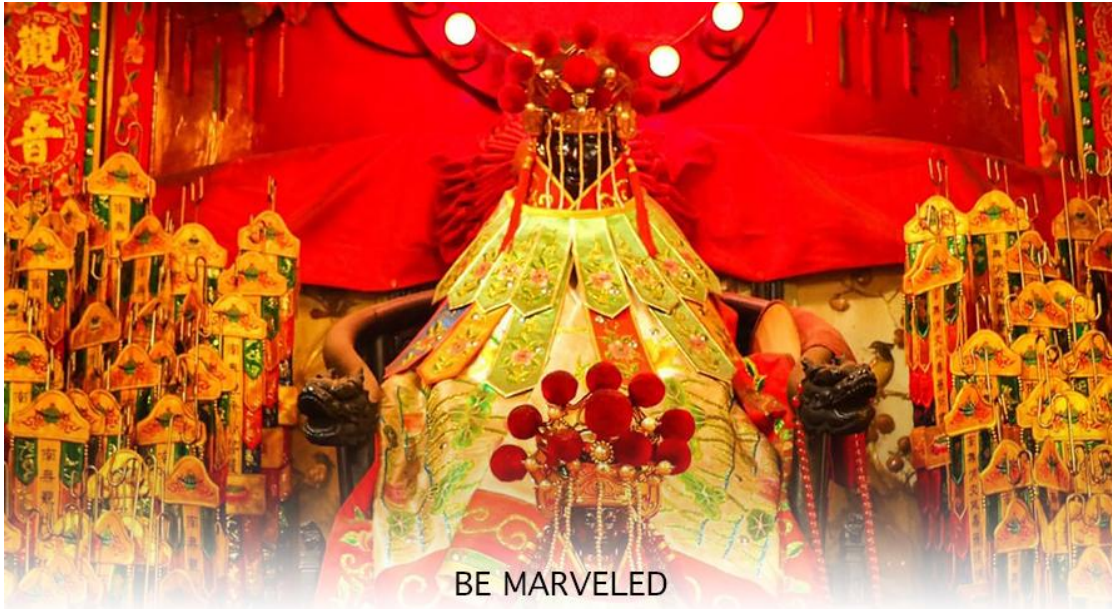
BE MARVELED วัดเจ้าแม่กวนอิมฮ่องฮ่า (ยิมวิน)

ถูกสร้างขึ้นในปี ค.ศ. 1873 ด้วยสถาปัตยกรรมแบบวัดจีนดั้งเดิม ในทุกๆ ปี จะมีนักท่องเที่ยวทุกเชื้อชาติจากทั่วโลกแวะเวียนมากราบไหว้ รวมถึงมาร่วมพิธีขี้มเงิน เจ้าแม่กวนอิมฮ่องฮ่า หรือ วันเปิดทรัพย์ ซึ่ง 1 ปีจะมีฤกษ์ดีแค่ 1 วันเท่านั้น ปี 2569 เป็นวันที่ 14 มีนาคม 2569 นี้การทำพิธีขี้มเงินเจ้าแม่กวนอิม วันเปิดพระคลัง หรือ วันเปิดทรัพย์ เป็นความเชื่อของคนเชื้อสายจีน ทั้งฝั่งฮ่องกง และมาเก๊าถือเป็นพิธีศักดิ์สิทธิ์ในการขอพรเจ้าแม่กวนอิม เชื่อกันว่าเป็นการไหว้และการทำพิธีที่ช่วยเสริมดวงให้เงินทองไหลมาเทมา การขี้มเงินองค์กวนอิมที่ขึ้นชื่อเรื่องความเมตตา หรือทำการค้า เปิดธุรกิจค้าขายเจริญรุ่งเรือง