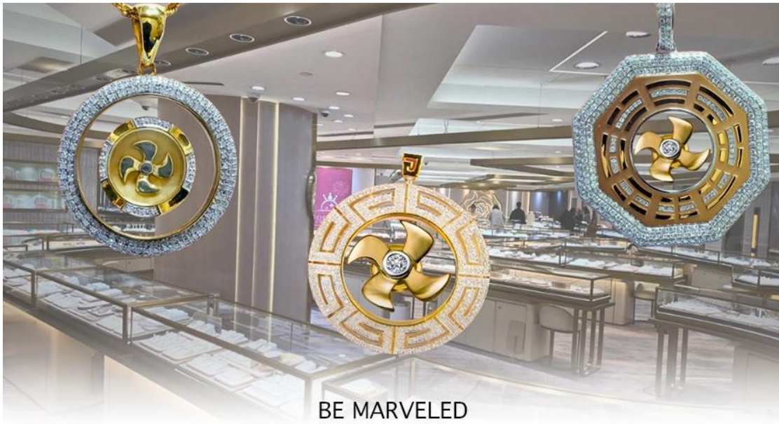
BE MARVELED ศูนย์ฮวงจุ้ย กัมฮินเศรษฐี

เป็นเครื่องประดับ ไม่ว่าจะ เป็น จี้, แหวน, กำไล หรือต่างหูเพื่อเป็นเครื่องประดับติดตัว และเสริมดวงชะตา ซึ่ง สินค้าทุกชนิด มีเอกสาร รับประกันคุณภาพเปลี่ยน หรือ ซ่อม ได้ตลอดอายุการใช้งาน หากเกิดการชำรุดจากสินค้า ไม่ใช่อุบัติเหตุ