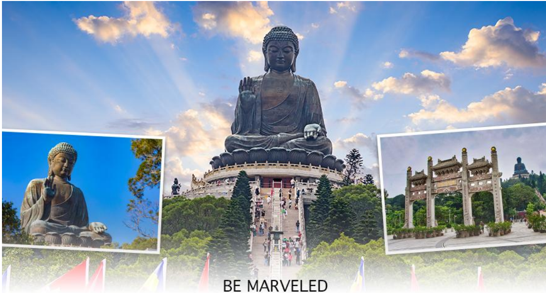
BE MARVELED พระใหญ่เทียนทาน

ใหญ่อย่างใกล้ชิดนั้น ต้องเดินขึ้นบันได จำนวน 268 ขั้นและได้รับเลือกให้เป็นสิ่งมหัศจรรย์ทางวิศวกรรมขั้นที่ 4 จากทั้งหมด 10 ชั้นของฮ่องกงในปี ค.ศ. 2000 ถือเป็นพระพุทธรูปองค์ใหญ่ที่เป็นสุดยอดของประติมากรรมทางพุทธศาสนาที่มีการผสมผสานระหว่างศิลปะสำริดแบบดั้งเดิมกับเทคโนโลยีสมัยใหม่ ชาวฮ่องกงเชื่อว่า หากใครได้มานมัสการขอพรองค์พระใหญ่แห่งนี้แล้ว ชีวิตก็จะมีแต่ความโชคดี มีความสุขสมหวัง และประสบความสำเร็จในทุกๆด้าน หลังจากไหว้พระแล้วท่านสามารถเลือกซื้อของฝาก, ของที่ระลึก จากหมู่บ้านนงปิง อาทิเช่น หยก ไข่มุก หรือเครื่องประดับคริสตัล เพื่อเป็นของที่ระลึก จากนั้นนั่งกระเช้ากลับลงมายังสถานีตุงซุง