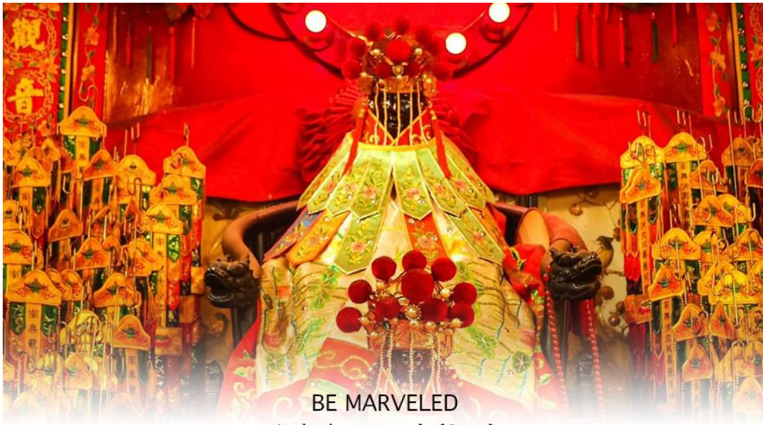
BE MARVELED วัดเจ้าแม่กวนอิมฮวงอ่า (ยิมวิน)

หรือ วันเปิดทรัพย์ เป็นความเชื่อของคนเชื้อสายจีน ทั้งฝั่งฮ่องกง และมาเก๊าถือเป็นพิธีศักดิ์สิทธิ์ในการขอพรเจ้าแม่กวนอิม เชื่อกันว่าเป็นการไหว้และการทำพิธีที่ช่วยเสริมดวงให้เงินทองไหลมาเทมา การขอขมเงินองค์กวนอิมที่ขึ้นชื่อเรื่องความเมตตา หรือทำการค้า เปิดธุรกิจค้าขายเจริญรุ่งเรือง