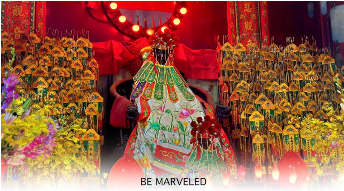
BE MARVELED วัดเจ้าแม่กวนอิมฮองฮ่า (ยิมวิน)

ให้เดินทางกลับไปกราบไหว้และขอบคุณเจ้าแม่กวนอิมอีกครั้ง โดยเตรียมชุดไหว้ และกระดวยเงินกระดวยทอง ที่เป็นเหมือนเงินที่เรานำมาคืน เป็นการไหว้เพื่อคืนเงินเจ้าแม่กวนอิมนั่นเอง