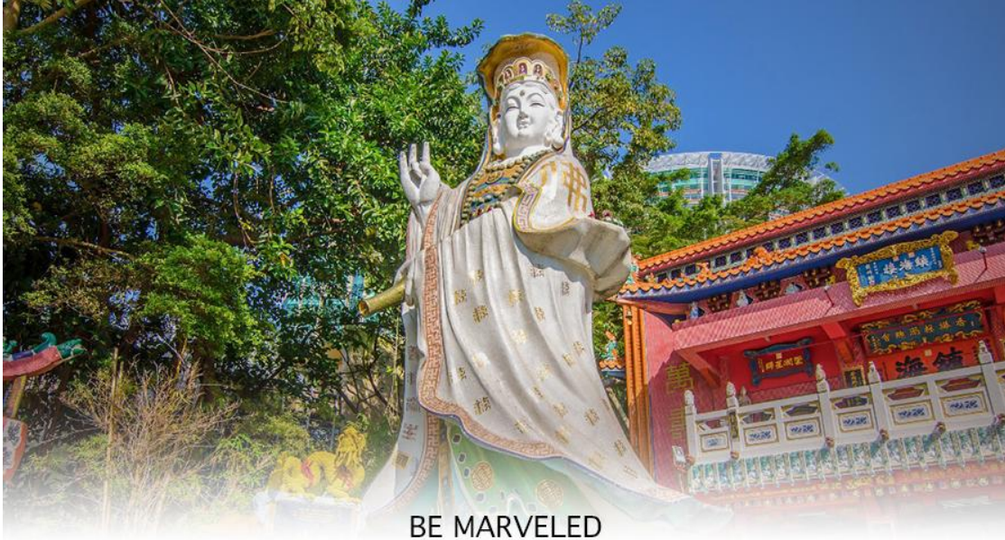
BE MARVELED วัดเจ้าแม่กวนอิมริพลัสเบย์

นำท่านเดินทางสู่ วัดเชิงหวี หรืออีกชื่อหนึ่งว่า “ วัดกัณฑ์ลม ” หนึ่งในวัดดังของฮ่องกง ที่ประชาชนให้ความเลื่อมใสศรัทธามานาน ด้านในศาลจะมีรูปปั้นสูงใหญ่ของท่านแซง ซึ่งเป็นเทพประจำวัดแห่งนี้ เชื่อว่าองค์ท่านศักดิ์สิทธิ์ในการขอพรด้านโชคลาภ เสริมความเป็นสิริมงคล ปิดเป่าเรื่องร้ายๆออกไป และวัดแห่งนี้ยังเป็นสถานที่ที่นิยมสำหรับท่านที่ต้องการแก้ปีชงอีกด้วย โดยวิธีการไหว้ขอพรจากท่านแซงนั้น ท่านจะต้องเข้าไปยืนอยู่เบื้อง หน้ารูปปั้นของท่าน แล้วอธิษฐานขอพรพร้อมกับมองหน้าท่านอย่างมุ่งมั่นตั้งใจ จากนั้นให้ท่านทำพิธีหมูน “กัณฑ์แห่งโชคชะตา” หรือ “กัณฑ์นำโชค” เพื่อหมูนรับแต่สิ่งดีๆ ให้เข้ามาในชีวิต