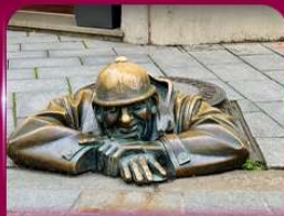
เชลฟี่คูคูมิล บราติสลาวา