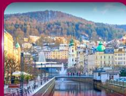
เมืองสปาแสนสวย คาร์โลวี่ วารี