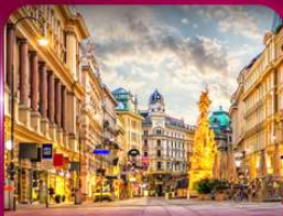
ชมเมืองโรมันติก เวียนนา