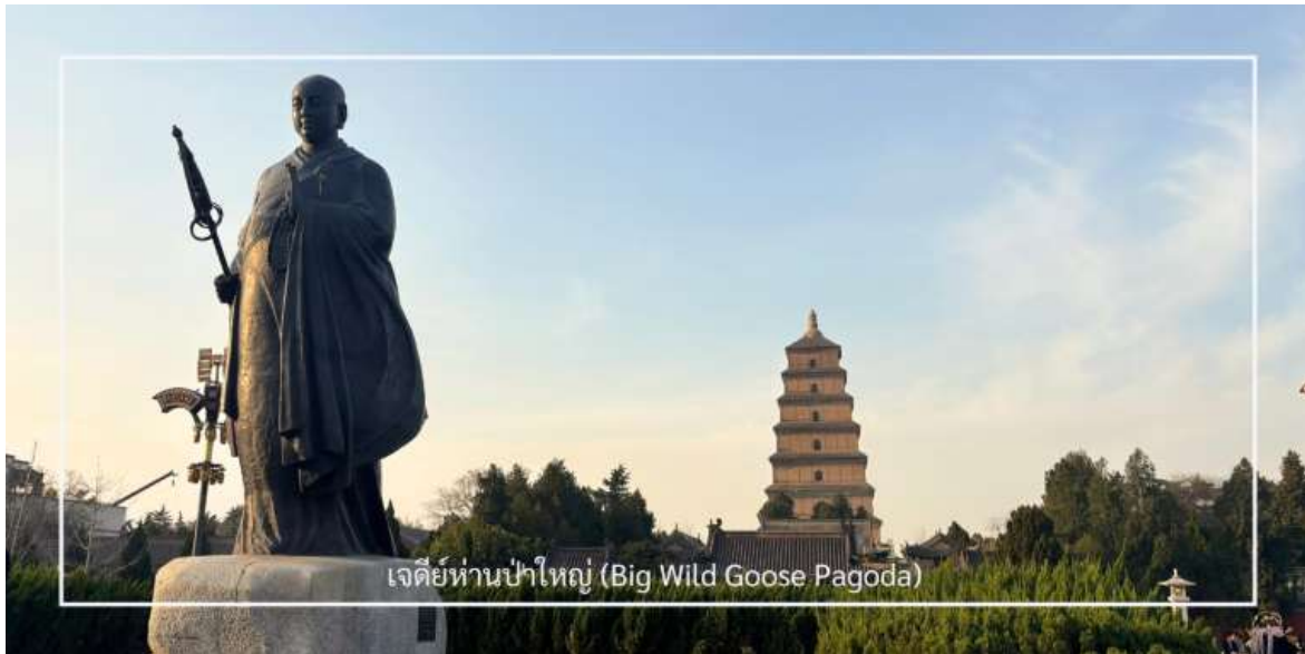
เจดีย์ห่านป่าใหญ่ (Big Wild Goose Pagoda)

นำท่านเดินทางสู่ เจดีย์ห่านป่าใหญ่ (Big Wild Goose Pagoda) ซึ่งตั้งอยู่ในบริเวณ วัดต้าซือเอิน (Da Ci'en Temple) สถานที่สำคัญทางพุทธศาสนาและประวัติศาสตร์ของจีน สร้างขึ้นในปี ค.ศ. 652 สมัยราชวงศ์ถัง เพื่อเก็บรักษาพระไตรปิฎกและพระธรรมคัมภีร์ที่ พระถังซำจั๋ง อัญเชิญกลับจากชมพูทวีป เจดีย์มีลักษณะทรงสี่เหลี่ยมแบบขั้นบันได สร้างด้วยอิฐเผา สะท้อนศิลปะจีนที่ผสมผสานอิทธิพลจากอินเดีย เดิมสูง 5 ชั้น ต่อมาได้รับการบูรณะจนมีความสูง 7 ชั้น (ประมาณ 64 เมตร) เป็นแบบอย่างของสถาปัตยกรรมพุทธศิลป์ยุคราชวงศ์ถังที่เรียบง่ายแต่ทรงพลัง ปัจจุบันเจดีย์แห่งนี้ถือเป็นสัญลักษณ์ทางวัฒนธรรมของเมืองซีอานและสถานที่ท่องเที่ยวยอดนิยมที่ควรมาเยือน