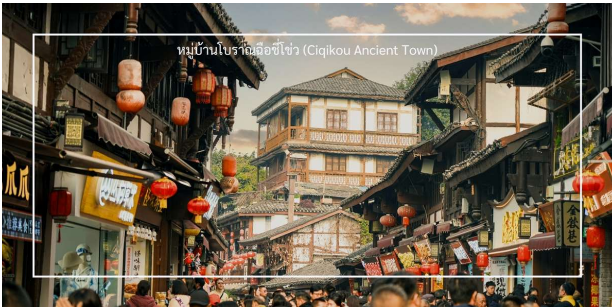
หมู่บ้านโบราณฉือชิว (Chiqikou Ancient Town)

เดินทางกลับลงซึ่งนำท่านเที่ยวชม หมู่บ้านโบราณฉือชิว (Chiqikou Ancient Town) เป็นหมู่บ้านโบราณที่มีเสน่ห์และเต็มไปด้วยประวัติศาสตร์ มีบรรยากาศที่เงียบสงบและเหมาะแก่การสำรวจ หมู่บ้านนี้มีบ้านเรือนและอาคารที่สร้างขึ้นในสไตล์จีนโบราณ ซึ่งมีการอนุรักษ์สถาปัตยกรรมไว้อย่างดี ทำให้ผู้เข้าชมรู้สึกเหมือนได้ย้อนเวลาไปในอดีต และถนนในหมู่บ้านมีความคึกคักและเต็มไปด้วยร้านค้าขายสินค้าท้องถิ่น ร้านอาหาร และของที่ระลึก ซึ่งคุณสามารถลิ้มลองอาหารท้องถิ่นและซื้อของที่ระลึกกลับบ้าน