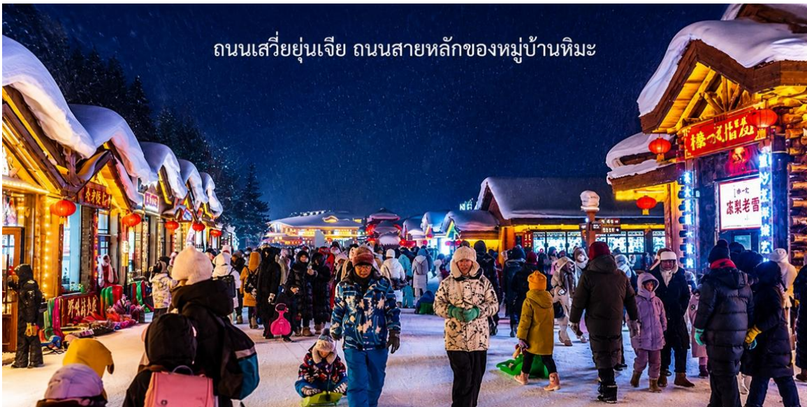
ถนนเสวียยูนเจีย ถนนสายหลักของหมู่บ้านหิมะ

นำท่านเดินชมบรรยากาศบน ถนนเสวียยูนเจีย ถนนสายหลักของหมู่บ้านหิมะ ที่เต็มไปด้วยร้านค้าของที่ระลึก ร้านอาหาร ห้องถื่น และร้านกาแฟน่ารัก ๆ ถนนสายนี้ถูกตกแต่งด้วยไฟประดับและโคมแดงสไตล์จีน เพิ่มเสน่ห์ให้บรรยากาศอบอุ่น และมีชีวิตชีวาท่านสามารถช้อปปิ้งสินค้าห้องถื่น หรือสินค้าแอนด์เมด พร้อมถ่ายภาพเก็บความทรงจำในมุมสวย ๆ ของหมู่บ้าน ได้ตลอดทั้งคืน