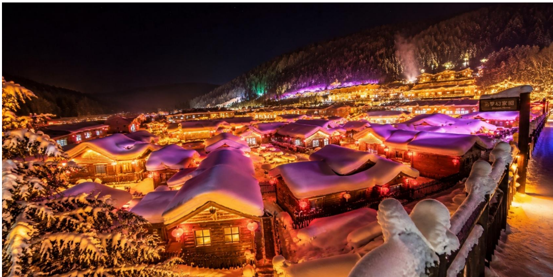
TF-HRBXJ09 ฮาร์บิน เทศกาลน้ำแข็งนานาชาติ พักหมู่บ้านหิมะหยองอัน สวนตุ๊กตาหิมะ 6วัน 4คืน บิน XJ #ทัวร์ไม่ลงร้าน Page 8 of 15

อิสระให้ท่านเดินชมบรรยากาศยามค่ำคืนของหมู่บ้านหิมะ ที่แต่งแต้มด้วยแสงไฟจากโคมแดงสไตล์จีน ส่องประกายสว่าง ไสวทั่วหมู่บ้าน ช่วงเวลาประมาณ 18.30 น. สนุกสนานกับการแสดง ราวพื้นบ้านจีน บริเวณลานกลางแจ้ง โดยมี ชาวบ้านท้องถิ่นร่วมร้องรำและเชิญชวนนักท่องเที่ยวเข้าร่วมเต้นรำกลางลาน ท่ามกลางเสียงเพลงพื้นเมือง สร้างความ ประทับใจไม่รู้ลืม หลังจากนั้นนำท่าน ชมแสงสีภายในหมู่บ้านหิมะ Dream Home Option: Dream Home (ราคา 198 หยวน) สัมผัสบรรยากาศราวกับดินแดนแห่งเทพนิยาย เก็บภาพประทับใจกับบ้านไม้ดั้งเดิมที่ถูกหิมะปกคลุม จนหลังคาโค้งมนคล้ายดอกเห็ดขาว ท่ามกลางแสงไฟหลากสีที่ตกแต่งอย่างอบอุ่นและโรแมนติกมีเสน่ห์เฉพาะตัว