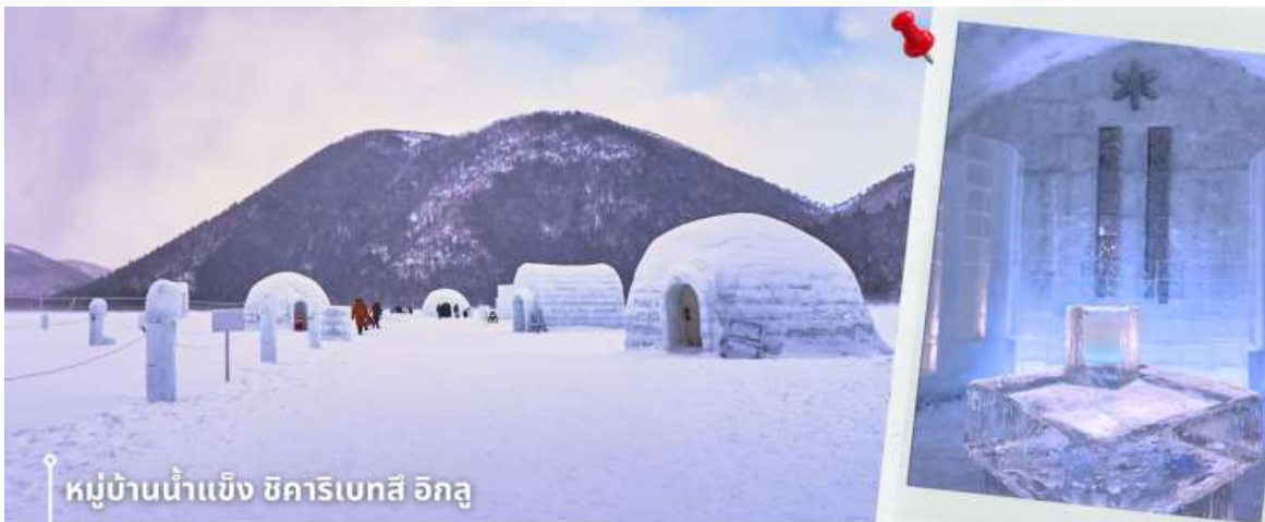
หมู่บ้านน้ำแข็ง ชิคาริเบตสึ อิกู

เช้า รับประทานอาหารเช้าที่ โรงแรม (4) หลังรับประทานอาหารเช้า นำท่านเดินทางสู่ เมืองชิคาโออิ เพื่อพาท่านสู่ หมู่บ้านน้ำแข็งชิคาริเบตสึ อิกู อยู่ที่ ทะเลสาบชิคาริเบตสึ (Lake Shikaribetsu) เป็นทะเลสาบธรรมชาติที่ตั้งอยู่ในอุทยานแห่งชาติไดเซดสิซัง บน เกาะฮอกไกโด โดดเด่นด้วยธรรมชาติอันเจียบสงบ รายล้อมด้วยภูเขาและผืนป่า พร้อมอากาศหนาวเย็นที่ปกคลุม พื้นที่ในช่วงฤดูหนาว จนกลายเป็นหนึ่งในจุดท่องเที่ยวฤดูหนาวที่มีชื่อเสียงของฮอกไกโด ในช่วงฤดูหนาว บริเวณ ทะเลสาบจะถูกเนรมิตให้กลายเป็น “หมู่บ้านน้ำแข็งชิคาริเบตสึ อิกู” หรือ Shikaribetsu Kotan หมู่บ้านน้ำแข็งที่ สร้างขึ้นจากหิมะและน้ำแข็งจริงโดยน้ำแข็งจะมีความใสเป็นพิเศษเนื่องจากน้ำในทะเลสาบแห่งนี้ได้ชื่อว่าเป็นน้ำที่ ใสบริสุทธิ์อีกแห่งหนึ่งในฮอกไกโด ภายในงานสามารถเดินชมบ้านอิกู คาเฟ่ น้ำแข็ง โบสถ์น้ำแข็ง รวมถึงมุมถ่ายรูป สุดสวย สร้างบรรยากาศราวกับเมืองน้ำแข็งกลางหุบเขาหิมะ นอกจากนี้ยังมีกิจกรรมฤดูหนาวหลากหลาย อย่างการ แช่ออนเซ็นกลางแจ้งริมทะเลสาบ (ไม่รวมค่าแช่ออนเซ็น) ท่ามกลางวิวหิมะสีขาวอันเจียบสงบ ถือเป็นอีกหนึ่ง ประสบการณ์ฤดูหนาวอันเป็นเอกลักษณ์ของฮอกไกโดที่ไม่ควรพลาด