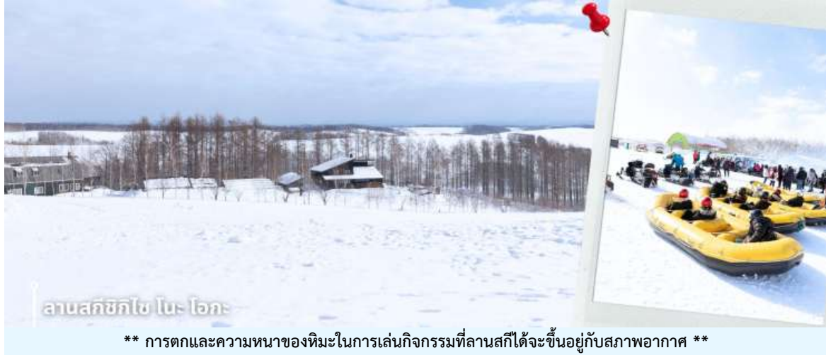
ลานสกีชิโก โนะ โอกะ

ที่ลัดเลาะไปตามเนินหิมะ กิจกรรมขับ สโนว์โมบิลสุดเร้าใจ หรือจะเล่นเลื่อนหิมะและปั้นตุ๊กตาหิมะ ท่ามกลางทัศนียภาพชาวโพลนของเมืองบิเอะ พร้อมชมวิวภูเขาที่สวยงามตระหง่านอยู่เบื้องหลัง