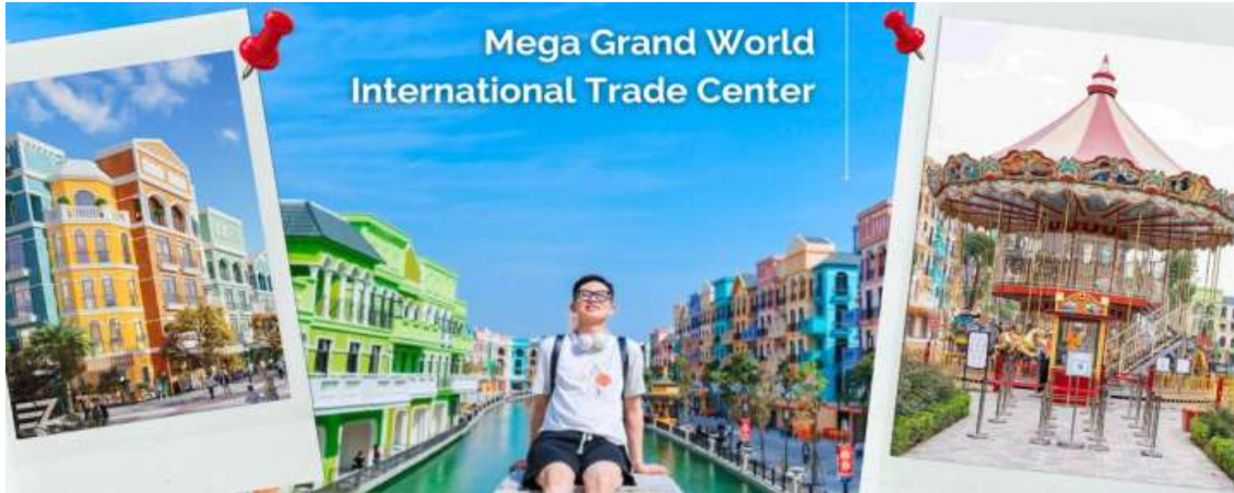
เที่ยง บริการอาหารเที่ยง ณ ภัตตาคาร (11)

จุดหมายปลายทางสำหรับนักท่องเที่ยวที่ต้องการสัมผัสวัฒนธรรม ศิลปะ สถาปัตยกรรมร่วมสมัยของเอเชีย – ยุโรป ที่ถ่ายทอดผ่านทางอาคารบ้านเรือน และการตกแต่งด้วยกลิ่นไอความเป็นอิตาเลียน ท่านจะได้เพลิดเพลินไปกับ ร้านค้ามากมาย ให้เลือกซื้อของฝาก ต่างๆ และเต็มไปด้วยมุมถ่ายรูปมากมาย ที่สามารถ ใช้เวลาเดินทาง ได้ตลอดทั้งวันไม่มีเบื่อ