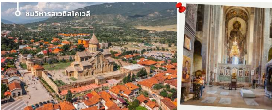
ชมวิหารสเวตีสโคเวลี

นำท่านออกเดินทางชม วิหารสเวตีสโคเวลี (Svetitskhoveli Cathedral) โบสถ์เก่าแก่ที่ถือเป็นศูนย์กลางทางศาสนา อัครคีรีสิทธิ์ที่สุดของจอร์เจีย มีขนาดใหญ่เป็นอันดับสองของประเทศ และเป็นศูนย์รวมจิตใจของชาวคริสต์ออร์ทอดอกซ์ สร้างขึ้นในราวศตวรรษที่ 11 ตัวโบสถ์มีสถาปัตยกรรมที่งดงามตามแบบฉบับของจอร์เจีย โดมสูงเด่นตระหง่าน บ่งบอกถึงความยิ่งใหญ่และศักดิ์สิทธิ์ ภายในวิหารประดับประดาด้วยภาพเขียนฝาผนังที่งดงามเล่าเรื่องราวทางศาสนา และยังมี หอคอยสูงที่สามารถมองเห็นวิวเมืองมิชเคต้าได้อย่างสวยงาม