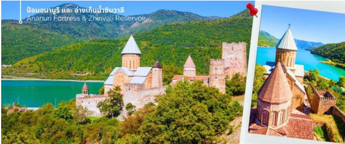
ป้อมอนานูรี และ อ่างเก็บน้ำชินวาลี Ananuri Fortress & Zhinvali Reservoir

จากนั้นนำท่านถ่ายภาพความงามของ อ่างเก็บน้ำชินวาลี (Zhinvali Reservoir) เป็นอ่างเก็บน้ำที่สวยงามและมีชื่อเสียง สร้างขึ้นในปี 1986 ด้วยวัตถุประสงค์หลักเพื่อผลิตไฟฟ้าพลังน้ำและจัดสรรน้ำสำหรับการอุปโภคบริโภค โอบล้อมด้วยทิวทัศน์อันตระการตา ด้วยภูเขาและป่าไม้อันเขียวขจี และความหลากหลายทางธรรมชาติ