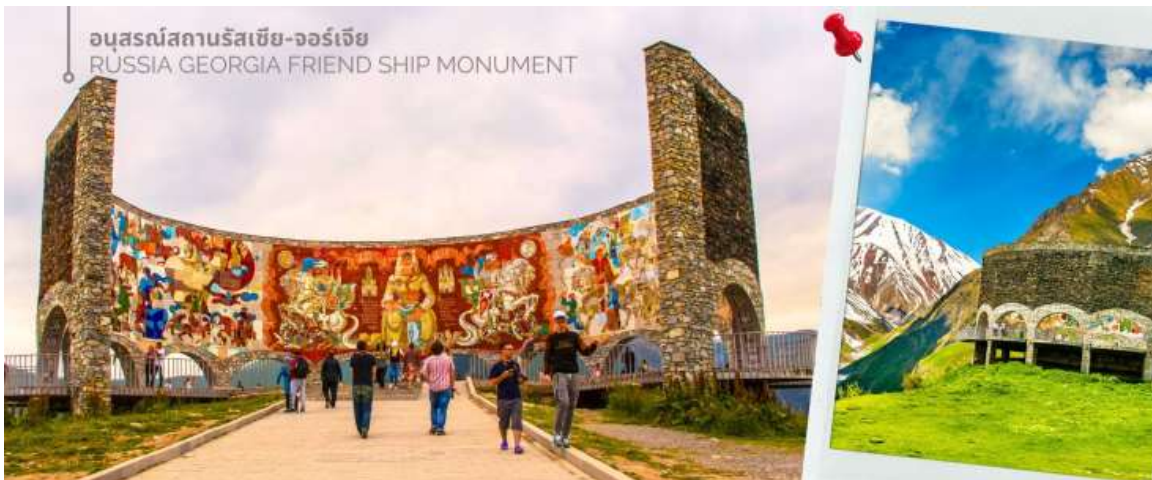
อนุสรณ์สถานรัสเซีย-จอร์เจีย RUSSIA GEORGIA FRIEND SHIP MONUMENT

จากนั้นนำท่านแวะถ่ายภาพและชมความงามของ อนุสรณ์สถานรัสเซีย-จอร์เจีย (RUSSIA GEORGIA FRIEND SHIP MONUMENT) เป็นอนุสรณ์หินคอนกรีตทรงกลมขนาดใหญ่ สร้างขึ้นในปี ค.ศ. 1983 เพื่อเฉลิมฉลองครบรอบ 200 ปีของสนธิสัญญาจอร์เจียฟสกี (Treaty of Georgie ski) ซึ่งเป็นการแสดงถึงความสัมพันธ์อันดีระหว่างรัสเซียและจอร์เจียในช่วงเวลานั้น อนุสรณ์สถานนี้มีความสูงประมาณ 20 เมตร และถูกออกแบบในสไตล์สถาปัตยกรรมโซเวียต ตัวอาคารมีรูปทรงกลมขนาดใหญ่ ภายในตกแต่งด้วยกระเบื้องโมเสกสีสดใส ซึ่งบอกเล่าเรื่องราวประวัติศาสตร์และวัฒนธรรมของทั้งสองชาติ ตั้งอยู่บนเส้นทางระหว่างเมืองกูดาอูรีและคาซเบก และทำเลบนยอดเขาสูง ทำให้เป็นจุดชมวิวที่สามารถมองเห็นทิวทัศน์อันงดงามของเทือกเขาคอเคซัสได้ ปัจจุบัน อนุสรณ์สถานแห่งนี้ยังคงตั้งอยู่ แต่ความหมายของมันได้เปลี่ยนแปลงไปอย่างสิ้นเชิง หลังจากการล่มสลายของสหภาพโซเวียต โดยเฉพาะอย่างยิ่งสงครามรัสเซีย-จอร์เจียในปี ค.ศ.2008 ทำให้ความสัมพันธ์ระหว่างสองประเทศตึงเครียดขึ้นอย่างมาก และส่งผลกระทบต่อความหมายของอนุสรณ์สถานแห่งนี้