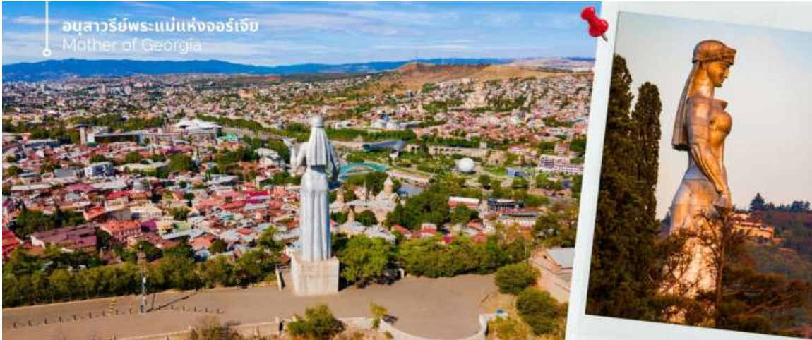
อนุสาวรีย์พระแม่แห่งจอร์เจีย Mother of Georgia

จากนั้นนำท่านขึ้นกระเช้าลอยฟ้าชม ป้อมนาริกาล่า (Narikala Fortress) (ร่วมค่ากระเช้า ขึ้น-ลง) ป้อมปราการโบราณขนาดใหญ่ที่ตั้งอยู่บนยอดเขา สามารถมองเห็นกำแพงเมือง และวิวทิวทัศน์ของเมืองด้านล่างได้แบบพาโนรามา โดยป้อมมีประวัติศาสตร์ยาวนานกว่า 1,700 ปี ตั้งแต่ศตวรรษที่ 4 โดยชื่อ "นาริกาลา" ในภาษาเปอร์เซียมีความหมายว่า "ป้อมที่ไม่สามารถตีแตก" ซึ่งสะท้อนให้เห็นถึงความแข็งแกร่งและความสำคัญของป้อมแห่งนี้ในอดีต แม้ว่าเคยเสียหายจากแผ่นดินไหว เหลือเพียงซากปรักหักพัง แต่ก็มีการบูรณะโบสถ์ภายในป้อมขึ้นมาใหม่