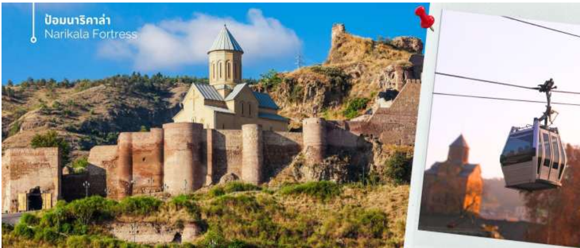
ป้อมนาริกาล่า Narikala Fortress

จากนั้นนำท่านขึ้นกระเช้าลอยฟ้าชม ป้อมนาริกาล่า (Narikala Fortress) (ร่วมค่ากระเช้า ขึ้น-ลง) ป้อมปราการโบราณขนาดใหญ่ที่ตั้งอยู่บนยอดเขา สามารถมองเห็นกำแพงเมือง และวิวทิวทัศน์ของเมืองด้านล่างได้แบบพาโนรามา โดยป้อมมีประวัติศาสตร์ยาวนานกว่า 1,700 ปี ตั้งแต่ศตวรรษที่ 4 โดยชื่อ "นาริกาลา" ในภาษาเปอร์เซียมีความหมายว่า "ป้อมที่ไม่สามารถตีแตก" ซึ่งสะท้อนให้เห็นถึงความแข็งแกร่งและความสำคัญของป้อมแห่งนี้ในอดีต แม้ว่าเคยเสียหายจากแผ่นดินไหว เหลือเพียงซากปรักหักพัง แต่ก็มีการบูรณะโบสถ์ภายในป้อมขึ้นมาใหม่