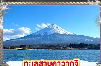
ทะเลสาบคาวากุจิ