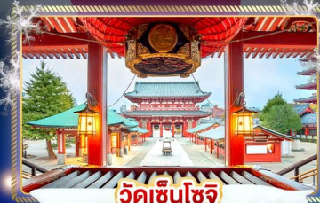
วัดเซ็นโซจิ

เที่ยวชมงานประดับไฟฤดูหนาว SAGAMIKO ILLUMINATION เช็กอินลานสกี ชมวิวภูเขาไฟฟูจิ