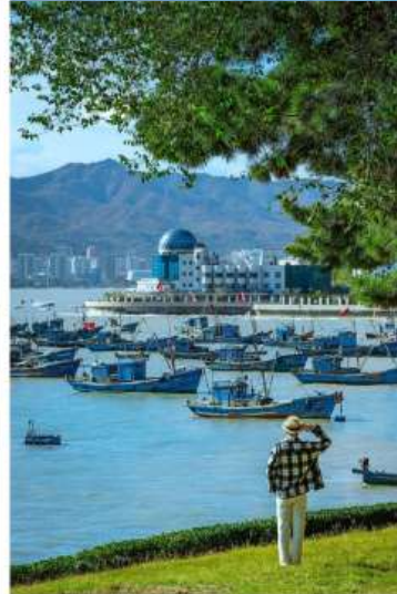
เดินทางไปยัง