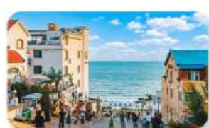
ถนนคนเดินเฟิงผิงสายที่แปด