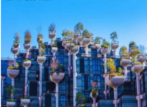
Tian An 1000 Trees

นำท่านเดินทางสู่ เทียนอันเซียนซู่ (Tian An 1,000 Trees) หรือเรียกว่า อาคารพันต้นไม้อัจฉริยะของอาคารพาณิชย์ที่ประดับตกแต่งด้วยต้นไม้มากกว่า 1,000 ต้น ได้รับการขนานนามว่าเป็นสิ่งมหัศจรรย์ของโลกสมัยใหม่ โดยคาดว่าต้นไม้ 1,000 ต้นเหล่านี้จะสามารถช่วยลดคาร์บอนไดออกไซด์ 21 ตันต่อปี ด้านในของอาคารมีทั้งสวนของที่พักอาศัย ร้านอาหาร ฟิฟิอรัลท์ แกลเลอรีศิลปะ อาหารสำนักงานและห้างสรรพสินค้า