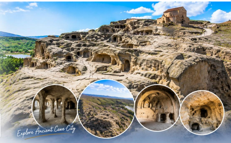
Explore Ancient Cave City

ตั้งอยู่บนพื้นที่อยู่รอบๆ หอโขงโบราณ และทางเดินเชื่อมต่อกันอย่างซับซ้อน โดยมีการตกแต่งภายในโดยศิลปินจอร์เจียนโบราณ