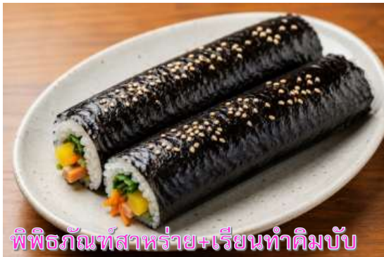
พิพิธภัณฑสถานหรัย+เรียนทำคิมบับ

เดินทางสู่ พิพิธภัณฑสถานหรัย ที่บอกเล่าเรื่องราว เกี่ยวกับสาหร่าย อาหารชั้นยอดของเกาหลี ที่กลายเป็นส่วนหนึ่งในวัฒนธรรมการประกอบอาหารของเกาหลี เรียนการทำคิมบับ เป็นกิจกรรมวัฒนธรรมเกาหลีที่เปิดโอกาสให้ได้เรียนรู้การทำอาหารประจำชาติ ร่วมกิจกรรมใส่ชุดฮันบกหลากหลายที่มีไว้ให้เลือก พร้อมถ่ายรูปกับฉากและพริอบที่เตรียมไว้เก็บเป็นที่ระลึกว่าครั้งหนึ่งเราได้เคยมาเยือนดินแดนที่มีวัฒนธรรมหลากหลายเช่นนี้