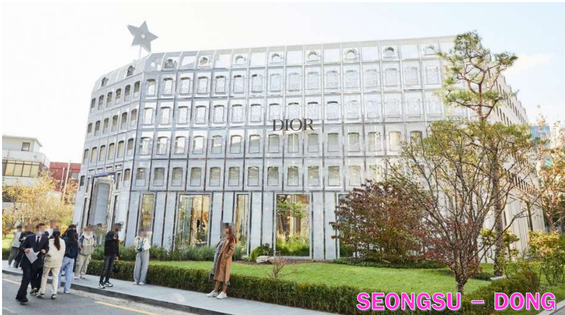
SEONGSU - DONG

กลางวัน รับประทานอาหารกลางวัน ณ ภัตตาคาร เมนูเทศกาล เมนูขึ้นชื่อจากเมือง ซุนซอน เป็นอาหารเกาหลีรสเด็ดหวานที่โดดเด่นด้วยเนื้อไก่หมักซอสโคจูจิ้งเข้มข้น ผสมพริกป่น กระเทียม ซีอิ๊ว และเครื่องปรุงสูตรพิเศษ หมักจนซึมเข้าเนื้อ ก่อนนำไปผัดบนกระทะร้อนพร้อมกะหล่ำปลี หอมใหญ่ มันหวาน และเส้นด็อกเหินยวุ่นๆ ให้รสชาติกลมกล่อม หอมเครื่องเทศ นิยมรับประทานร้อน ๆ คู่กับข้าวสวย หรือเพิ่มซีสียัด ๆ เพื่อเพิ่มความเข้มข้นและความอร่อยยิ่งขึ้น