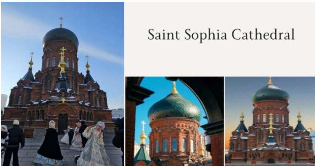
Saint Sophia Cathedral

จากนั้นนำท่านถ่ายรูปกับ โบสถ์เซนต์โซเฟีย (บริเวณภายนอก) เป็นมหาวิหารที่ตั้งอยู่ใจกลางเมืองฮาร์บิน ในอดีตถือเป็นโบสถ์นิกายออร์ทอด็อกซ์ที่ใหญ่ที่สุดในเอเชียตะวันออก สวยงามโดดเด่นด้วยสถาปัตยกรรมแบบรัสเซีย ปัจจุบันภายในเป็นพิพิธภัณฑ์ที่จัดแสดงรูปภาพ รวมถึงประวัติของเมืองฮาร์บินในยุคต่าง