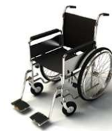
การรับบริการดูแลเป็นพิเศษ

กรณีผู้เดินทางต้องการความช่วยเหลือเป็นพิเศษ อาทิเช่น การใช้วีลแชร์ กรุณาแจ้งบริษัทฯ อย่างน้อย 7 วันก่อนการเดินทาง มิฉะนั้นบริษัทฯ จะไม่สามารถจัดการล่วงหน้าได้ เนื่องจากการขอใช้วีลแชร์ในสนามบินนั้น ต้องมีขั้นตอนในการขอล่วงหน้า และบางสายการบินอาจมีการเรียกเก็บค่าใช้จ่ายทั้งทางสนามบินในไทยและในต่างประเทศ ซึ่งผู้เดินทางสามารถสอบถามกับเจ้าหน้าที่ได้โดยตรงก่อนทำการจอง และหากในคณะของท่านมีผู้ต้องการดูแลพิเศษ เช่น ผู้ที่นั่งรถเข็น (Wheelchair), เด็ก, ผู้สูงอายุและผู้ที่มีโรคประจำตัวหรือไม่สะดวกในการเดินทางท่องเที่ยวในระยะเวลาเกินกว่า 4 - 5 ชั่วโมงติดต่อกัน ท่านและครอบครัวต้องให้การดูแลสมาชิกภายในครอบครัวของตนเอง เนื่องจากการเดินทางเป็นหมู่คณะ หัวหน้าทัวร์มีความจำเป็นต้องดูแลคณะทัวร์ทั้งหมด