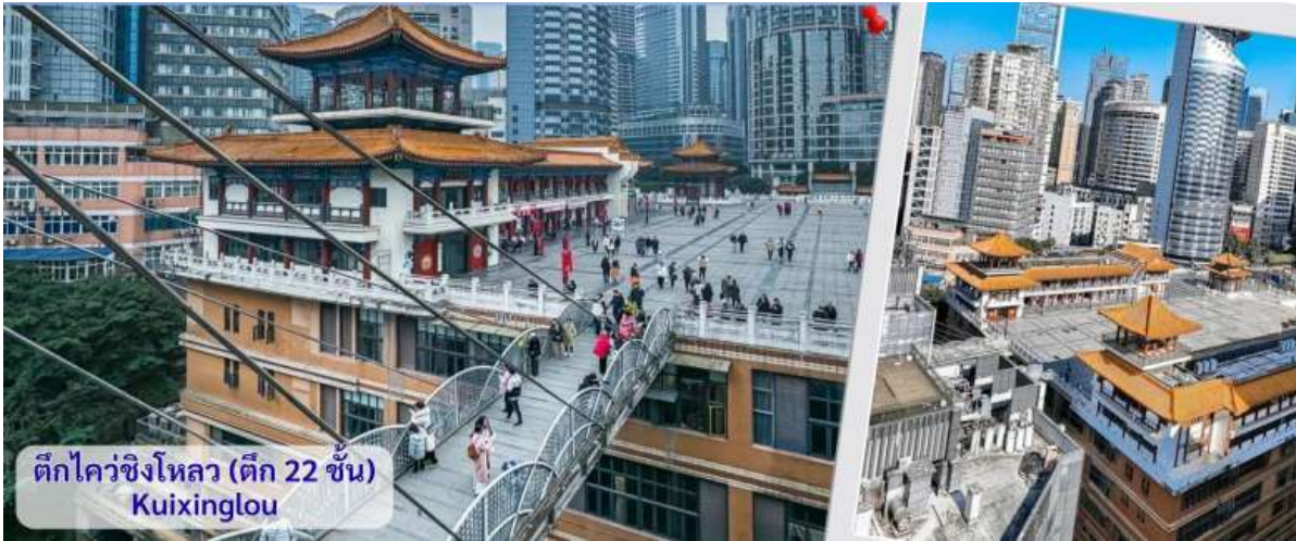
ตึกไควซิงโหลว (ตึก 22 ชั้น) Kuixinglou

จากนั้นอิสระถ่ายรูปหน้าตึกตะเกียบ ฉงชิ่ง(ด้านนอก) คือ ฉงชิ่งกั๋วไถ่อาร์ตเซ็นเตอร์ (Chongqing Guotai Arts Center) เป็นแลนด์มาร์กสำคัญที่มีสถาปัตยกรรมคล้ายตะเกียบยักษ์สีแดงและตัววางซ้อนกัน เป็นศูนย์จัดแสดงงานศิลปะและสถานที่ท่องเที่ยวที่นิยมสำหรับการถ่ายรูป โดยเฉพาะในเวลาากลางคืนเมื่อเปิดไฟสวยงาม สิ่งก่อสร้างอันมีเอกลักษณ์ อาคารนี้ถูกวางโครงสร้างให้มีรูปร่างคล้ายกอง "ตะเกียบยักษ์" สีดำและแดงที่วางซ้อนกันเป็นชั้นๆ ที่ส่วนปลายของตะเกียบสีแดงจะมีตัวอักษรจีนคำว่า "กั๋ว" ประทับอยู่ ซึ่งมีความหมายถึง ชาติหรือประเทศ ส่วนที่ปลายตะเกียบสีดำ จะมีอักษรจีนคำว่า "ไถ่" ประทับอยู่ ซึ่งหมายถึง ความเจียบสงบ หรือความอุดมสมบูรณ์