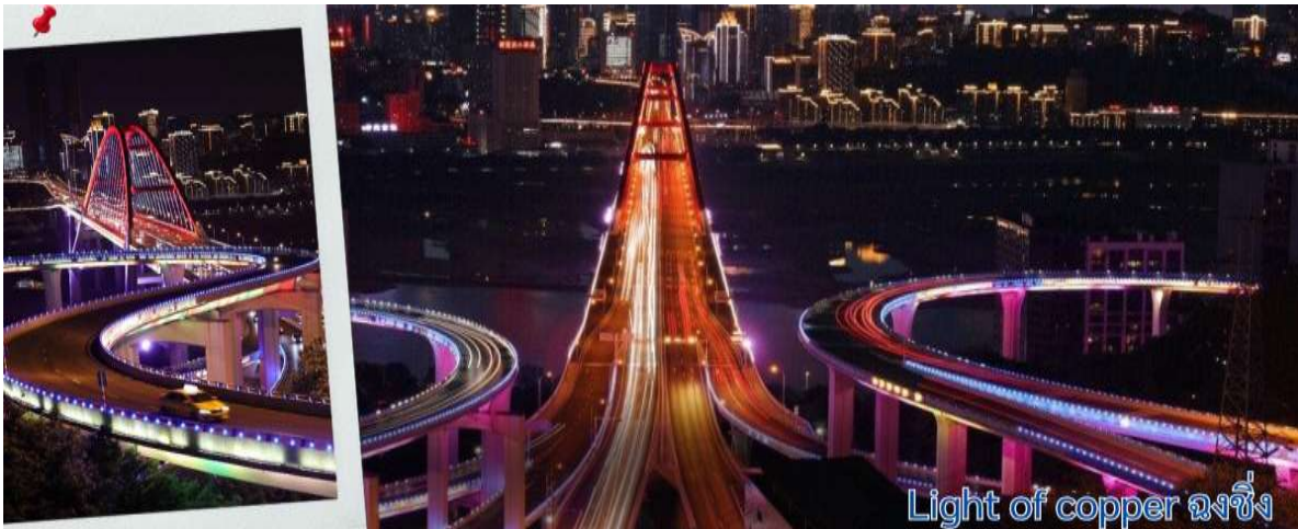
Light of copper ผองผิง

แวะถ่ายรูปวิวที่ Light of copper ผองผิง เป็นจุดชมวิวชื่อดังในมหานคร ผองผิง ประเทศจีน ซึ่งได้รับความนิยมอย่างมากในกลุ่มนักท่องเที่ยวและช่างภาพ จุดชมวิวทางยกระดับโดดเด่นด้วยทางเดินลอยฟ้าทรงกลมที่เชื่อมต่อกันสามารถมองเห็นวิวพาโนรามาของ สะพานซูเจียป่า (Sujiaba Interchange) ที่โค้งไปมาอย่างซับซ้อน และสะพานข้ามแม่น้ำแยงซีเกียง ไชหยวนป่า (Caiyuanba Bridge) ท่ามกลางตึกสูงระฟ้าบรรยากาศยามค่ำคืน เมื่อเปิดไฟเมืองในช่วงค่ำจะเห็นแสงสีทองและสีทองแดงสะท้อนความงดงามของ "เมืองภูเขา" ได้อย่างชัดเจน