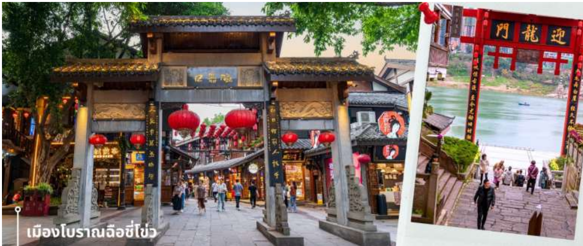
เมืองโบราณฉือชี่โซ่ว

หลังจากนั้นนำทุกท่านเดินทางสู่ เมืองโบราณฉือชี่โซ่ว เมืองโบราณและสถานที่ท่องเที่ยวชื่อดังในมหานครฉงชิ่ง ประเทศจีน ที่อนุรักษ์สถาปัตยกรรมและวิถีชีวิตดั้งเดิมไว้และได้เป็นสถานที่ท่องเที่ยวระดับ 4A ของจีน ประวัติศาสตร์ยาวนาน มีลักษณะคล้ายตลาดเก่าโบราณริมแม่น้ำเจียงหลิง เป็นแหล่งรวมของชนม ของกินพื้นเมือง ของฝาก รวมถึงมีวัดและร้านค้ามากมาย ให้ความรู้สึกเหมือนได้ย้อนเวลากลับไปในอดีต ภายในพื้นที่เต็มไปด้วยร้านค้าเก่าแก่ที่ขายทั้งอาหารพื้นเมือง ของกิน และของฝากมากมาย ทั้งยังมีการแสดงวัฒนธรรมพื้นบ้านให้นักท่องเที่ยวได้ชม ให้ความรู้สึกเหมือนหลุดเข้าไปในซีรีส์จีนย้อนยุค ที่เที่ยวฉงชิ่ง ที่เหมาะแก่การมาเดินเที่ยว ชิมอาหาร ถ่ายรูป และสัมผัสวิถีชีวิตแบบดั้งเดิมของชาวฉงชิ่งอย่างใกล้ชิดในบรรยากาศที่แสนสบาย