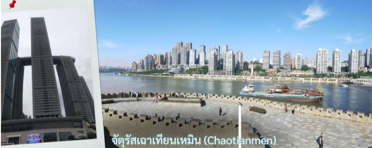
จัตุรัสเฉาเทียนเหมิน (Chaotianmen)

จุดบรรจบระหว่างแม่น้ำสองสาย โดยน้ำสีเหลืองของแม่น้ำแยงซีและน้ำสีเขียวมรกตของแม่น้ำเจียหลิงไหลมาบรรจบกันอย่างชัดเจน สร้างทัศนียภาพที่สวยงามและเป็นเอกลักษณ์ของผองผิงอย่างแท้จริง