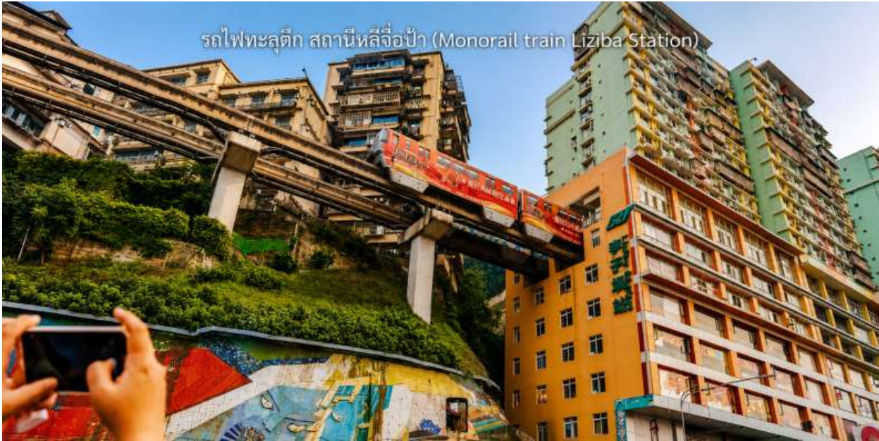
ประสบการณ์ที่ไม่เหมือนใคร

จากนั้นนำท่าน นั่งรถไฟทะลุตึก (Monorail Train) หนึ่งในประสบการณ์ที่น่าสนใจและเป็นเอกลักษณ์ในเมืองฉงชิ่ง รถไฟเส้นนี้มีเส้นทางที่ผ่านอาคารและที่อยู่อาศัย ทำให้ผู้โดยสารรู้สึกเหมือนกำลังนั่งรถไฟที่ทะลุผ่านตึกสูง เส้นทางที่น่าสนใจในรถไฟนี้รวมถึงสถานีที่มีชื่อเสียง เช่น สถานีหลี่จื่อป้า (Liziba Station) ซึ่งตั้งอยู่ในพื้นที่ที่มีความหนาแน่นของประชากร การนั่งรถไฟทะลุตึกนี้เป็นวิธีที่ยอดเยียมในการสัมผัสกับวัฒนธรรมเมืองฉงชิ่ง และชื่นชมกับการพัฒนาเมืองที่น่าทึ่ง หากคุณมีโอกาสไปเยือนฉงชิ่ง อย่าลืมนั่งรถไฟเส้นนี้เพื่อสัมผัส