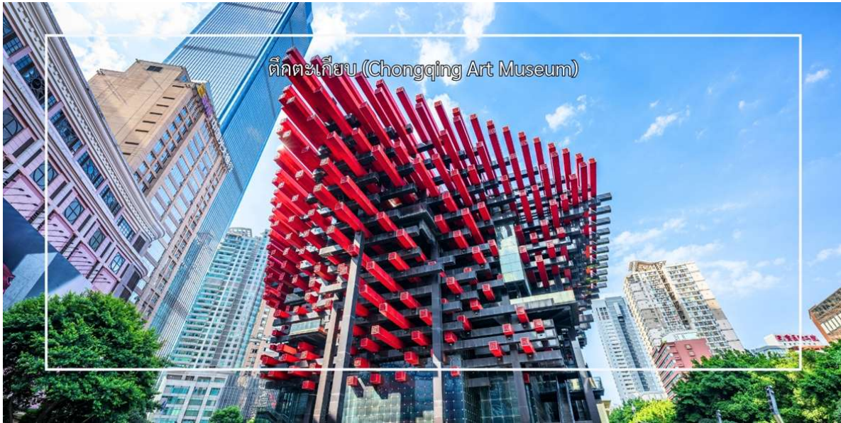
ตึกตะเกียบ (Chongqing Art Museum)

นำท่านสู่ ถนนคนเดินเจี๋ยฟางเป่ย์ (Jiefangbei Pedestrian Street) ย่านการค้าและแลนด์มาร์กสำคัญที่สุดแห่งหนึ่งของเมือง ฉงชิ่ง และได้รับการขนานนามว่าเป็น "ถนนสายแรกแห่งจีนตะวันตก" โดยมีอนุสาวรีย์ปลดปล่อยประชาชน (Jiefangbei Monument) ตั้งอยู่ใจกลางย่านแห่งนี้ ที่นี่คือหนึ่งในแหล่งช้อปปิ้งและท่องเที่ยวที่สำคัญที่สุดในเมืองฉงชิ่ง (Chongqing) เป็นพื้นที่ที่มีชีวิตชีวาและคึกคัก ถนนนี้ตั้งอยู่ใกล้กับสถานที่ท่องเที่ยวสำคัญอื่นๆ เช่น ตึกตะเกียบ ทำให้สามารถเดินเที่ยวชม เดินเล่น ถ่ายภาพ ได้อย่างสะดวก ถนนสายนี้มีบรรยากาศที่มีชีวิตชีวา และยังคงเต็มไปด้วยร้านค้าสินค้าแบรนด์เนมร้านค้าท้องถิ่นและร้านค้าขายสินค้าต่างๆ เช่น เสื้อผ้าเครื่องประดับและของที่ระลึก