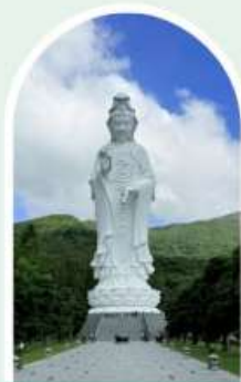
วัดเจ้าแม่กวนอิมซีซัน

"ไหว้พระ เสริมดวง เพิ่มสิริมงคลแก่ชีวิต"