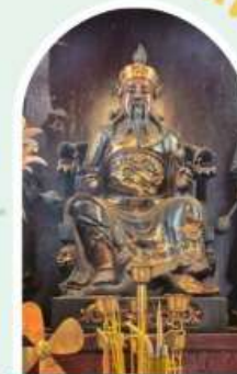
วัดป๊อโต