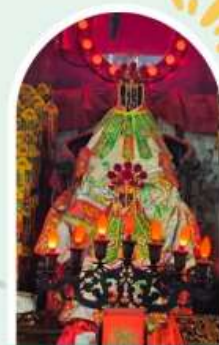
วัดเจ้าแม่กวนอิมองฮ่า