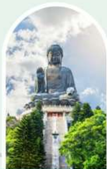
พระใหญ่โปะหลิน