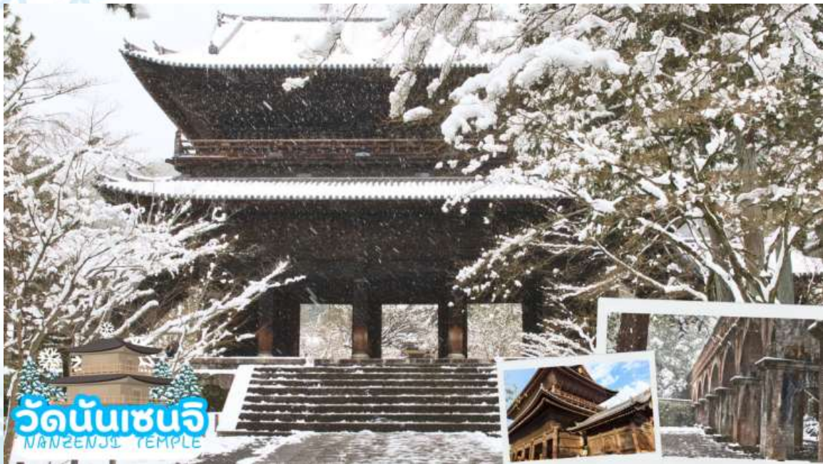
วัดนันเซ็นจิ NANZENJI TEMPLE

เดินทางสู่ เมืองเกียวโต (Kyoto) ซึ่งในอดีตเคยเป็นเมืองหลวงของประเทศญี่ปุ่น และยาวนานที่สุด คือ ตั้งแต่ปี ค.ศ. 794 จนถึง 1868 รวม ๆ 1,100 ปีเลยทีเดียว เมืองเกียวโตจึงเป็นเมืองที่มีสถานที่สำคัญ ๆ ที่เต็มไปด้วยประวัติศาสตร์และวัฒนธรรมดั้งเดิมของญี่ปุ่น