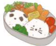
● อาหารสำหรับเด็ก ( 2-11 ปี ) * วัตถุประสงค์ขึ้นอยู่กับทวาราน