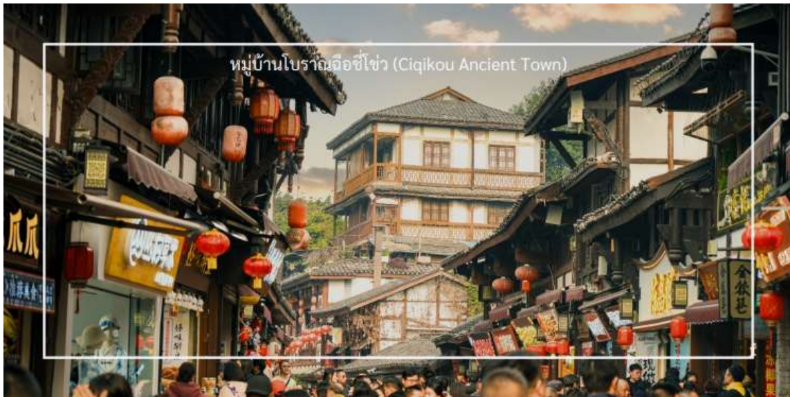
หมู่บ้านโบราณฉือซีไช่ (Ciqikou Ancient Town)

จากนั้นนำท่านเดินทางไปที่เที่ยวชม หมู่บ้านโบราณฉือซีไช่ (Ciqikou Ancient Town) เป็นหมู่บ้านโบราณที่มีเสน่ห์และเต็มไปด้วยประวัติศาสตร์ มีประวัติความเป็นมายาวนานกว่า 1,000 ปี ซึ่งเคยเป็นศูนย์กลางการค้าและการคมนาคมทางน้ำในสมัยโบราณ เมืองนี้เป็นที่รู้จักในฐานะหมู่บ้านการค้าขายที่สำคัญในยุคศตวรรษที่ 18-19 มีสถาปัตยกรรมที่สวยงาม