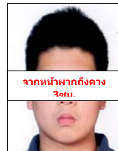
จากหน้ามากถึงคาง 3 ซม.