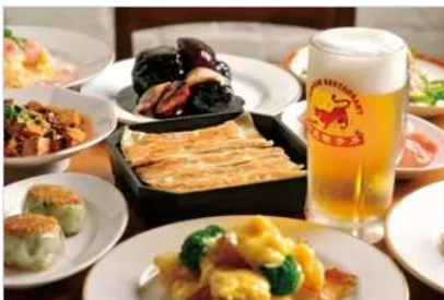
Gourmet BENITORA GYOZABOU

นำท่านเดินทางสู่ AEON TOWN SHOPPING MALL ท่านสามารถอิสระซื้อสินค้าทั่วไปของญี่ปุ่นเช่น ขนม, อาหารว่าง, ของเล่น, กระเป๋า, รองเท้า, เสื้อผ้า