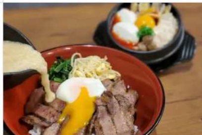
Gourmet MUGITORO & HAN