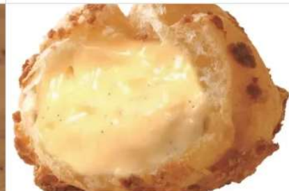
Gourmet Beard Papa