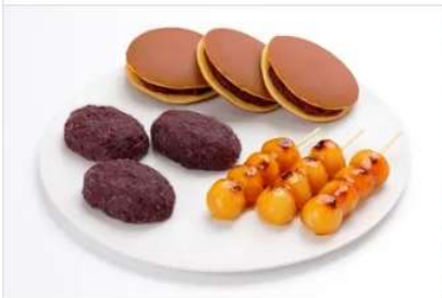
Gourmet KAKIYASU Kofukudo