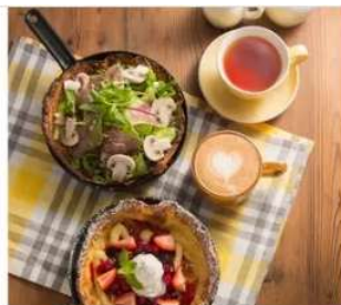
Gourmet Grace Garden Nature